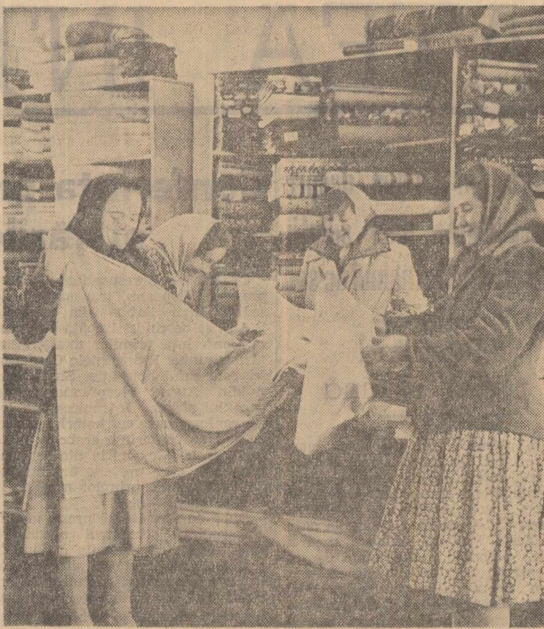
Magazinul universal din comuna Sărmășag, regiunea Crișana.

O dată cu intrarea în funcțiune a unor noi localuri, au fost renovate și reprofilate și vechile unități. Astfel, la Filipcești de Pădure (regiunea Ploiești), după construirea unui nou magazin universal cu etaj și a unui restaurant, în vechile localuri s-a deschis un magazin de confecții, altul de mobilă și o cofetărie. De asemenea, în centrul forestier Pîrșcov din raionul Cislău, pe lângă noul magazin universal și restaurant-anexă, în fostele localuri s-a deschis un magazin alimentară, o cofetărie și o librărie.