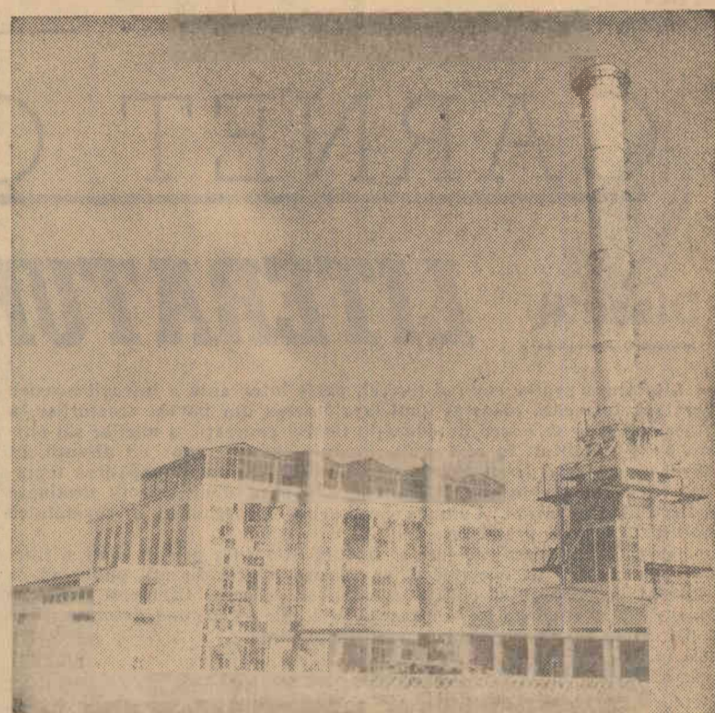
Centrala electrică de termoficare din Pitești furnizează abur pentru Combinatul de industrializare lemnului precum și pentru încălzirea cartierului de locuințe Ceair

Din capitala Franței au parvenit următoarele trei precizări cu privire la comunicatul Băncii Franței: 1) Această măsură nu are un caracter dramatic și brusc. Ea reprezintă o continuare, accentuată, esalonată în mod rațional, a unei politici inaugurată încă din iunie 1962. 2) Aplicarea ei va permite Franței să ajungă la aceeași situație pe care o au alte bănci centrale, cum sînt Banca Angliei, Banca Olandei și Banca Elveției, ale căror rezerve s-au depășesc 90 la sută. 3) Această politică exprimă în mod concret dorința guvernului francez de a provoca reorganizarea sistemului monetar internațional, care, după părerea ministrului de finanțe francez, tînde să acorde „un rol prea important moneturilor naționale de rezervă”. Sînt subînțelese aci dolarul și lira sterlină,