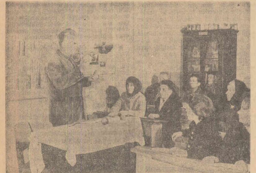
Membrii cooperativei agricole de producție din comuna Ilovăț, raionul Turnu Severin, frecventează cu regularitate cercurile din cadrul învățămîntului agrozootehnic. În clipșu: un aspect de la ultima lecție.

Mai puțin am solicitat de la cadrele didactice și de cercetare abordarea studiilor economice și de organizare a muncii. În viitor ne vom îndrepta mai mult atenția spre acest aspect deosebit de important al muncii noastre. Considerăm că linia adoptată de consiliul agricol în ceea ce privește folosirea sprijinului pe care-l vor da cadrele didactice și de cercetare din regiune s-a dovedit bună și acest lucru este evidențiat de rezultatele obținute atât în învățămînt și în cercetare științifică, cât și în activitatea de producție din unitățile agricole socialiste.