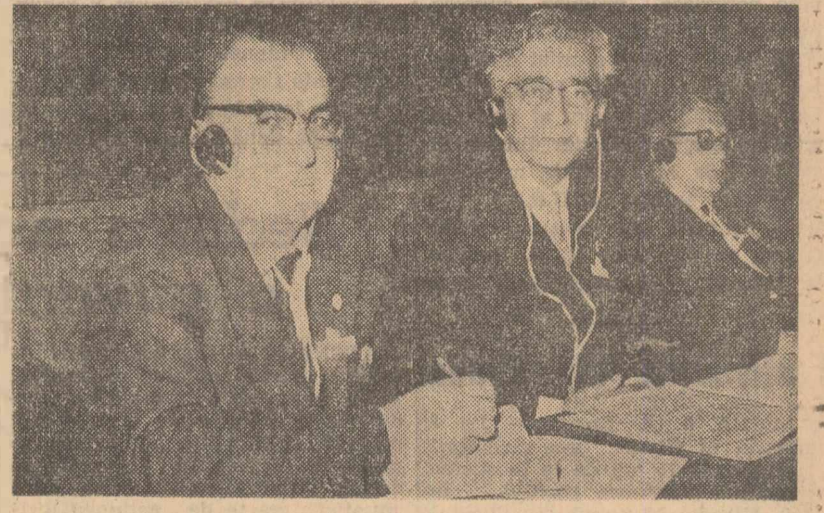
Membrii ai delegației geologilor romini în timpul unei ședințe a congresului

— Care a fost contribuția delegației romine la lucrările congresului? — Delegația țării noastre a prezentat cinci comunicări privind probleme de tectonică, micropaleontologie, sedimentologie, stratigrafia și istoria cristalinelor și geochimia elementelor rare, comunicări care au fost primite cu interes. De asemenea, în cadrul expoziției deschise în timpul lucrărilor congresului, delegația noastră a prezentat harta geologică a R.P.R., — scara 1 : 500 000 — care s-a bucurat de bune aprecieri. Noi am făcut și propunerea — acceptată de alfel — de afiliere a țării noastre la Asociația mineralogică internațională. De asemenea, o parte din delegații romine au fost aleși în unele comisii și comitete ale congresului. Atât în timpul lucrărilor cât și în timpul excursiilor, gazdele noastre au dat posibilitatea participanților la congres să ia cunoștință nu numai de peisajul geologic atât de variat al Indiei dar și de realizările remarcabile ale geologilor indieni. Am stabilit relații de bună colaborare cu alți specialiști de peste hotare. Geologii participanți s-au declarat interesați să cunoască țara noastră. Un bun prieten pentru geologii străini de a cunoaște realizările noastre va fi înlesnit de viitorul congres care se va ține la Praga și în al cărui program de excursii figurează și lanțul carpatic al țării noastre.