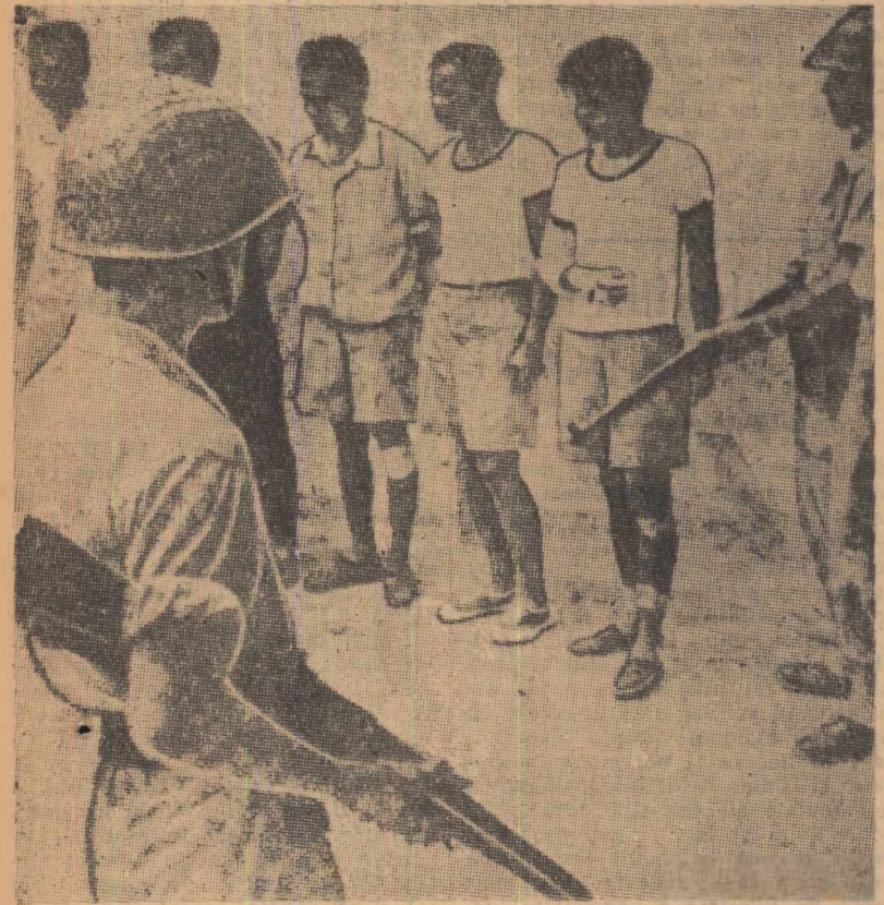
În urmă cu câteva zile, o unitate aeronavală olandeză a lansat un atis neprovocat împotriva unei unități a marinei Republicii Indonezia, care efectua o misiune obișnuită de patrulare în dreptul insulelor Aru, la sud de Irian de Vest. În cișeu: Soldați ai marinei Republicii Indonezia, luați prizonieri de către trupele coloniale olandeze.

După cum indică agenția REUTER, complotiștii erau exponenții unei grupări de dreapta. Complotul era îndreptat în primul rînd împotriva ministrului de Finanțe, Felix Bandaranaike, cunoscut pentru opiniile sale progresiste.