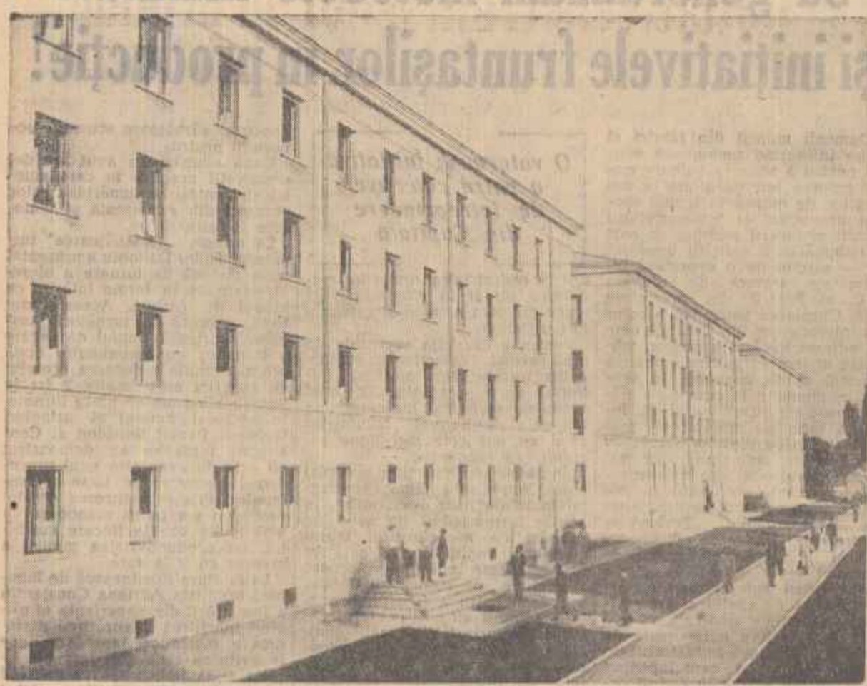
Linia bătrina grădina a Copoului din Iași, s-a ridicat în ultimii ani, printre altele, construcția și un mare edificiu științific. Este vorba de Institutul Agronomic. Via-verde de acesta s-a ridicat pentru studenții institutului, construcția unei cămin formează din trei blocuri cu instalații moderne în care studenții găsesc condiții de învățare și odihnă din cele mai bune. În dreapta: Blocurile cămin ale Institutului Agronomic din Iași.