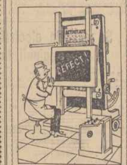
Medical radiolog — Deși aparatul este defect, vîd că reflectă bine activitatea secției de sănătate a satului popular orășenesc Tg. Mureș...