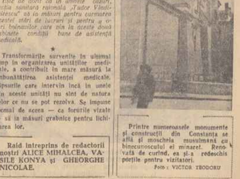
Printre numeroasele monumente și construcții din Constanța se află și moscheia musulmană cu binecunoscutul ei minaret. Renovată de curînd, ea și-a redeschis porțile vizitorilor.

Te lingă club funcționează un curs de croșetare care de altfel a fost absolvit de 100 de muncitori din fabrică și apoi ale constructorilor de autoamobila. De asemenea în cadrul clubului funcționează un curs în care se predau limbile rusă, germană și engleză.