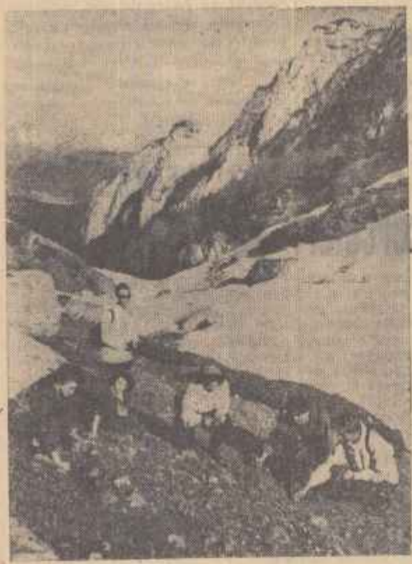
Primăvara în Valea Cerbului

PRESEDINTELE: — Pentru ce ne ia în primire la ziare? CETĂTEANUL: — Pentru că nu ați fixat orele... de primire! Desen de GIL. CHIȘERIU