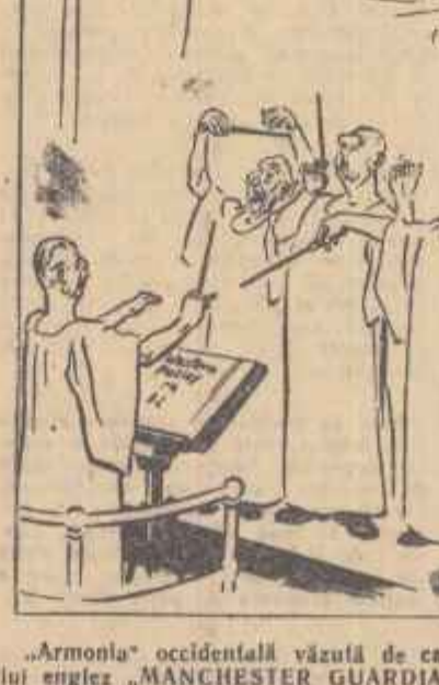
„Armonia” occidentală văzută de caricaturistul zărilor englez „MANCHESTER GUARDIAN”.