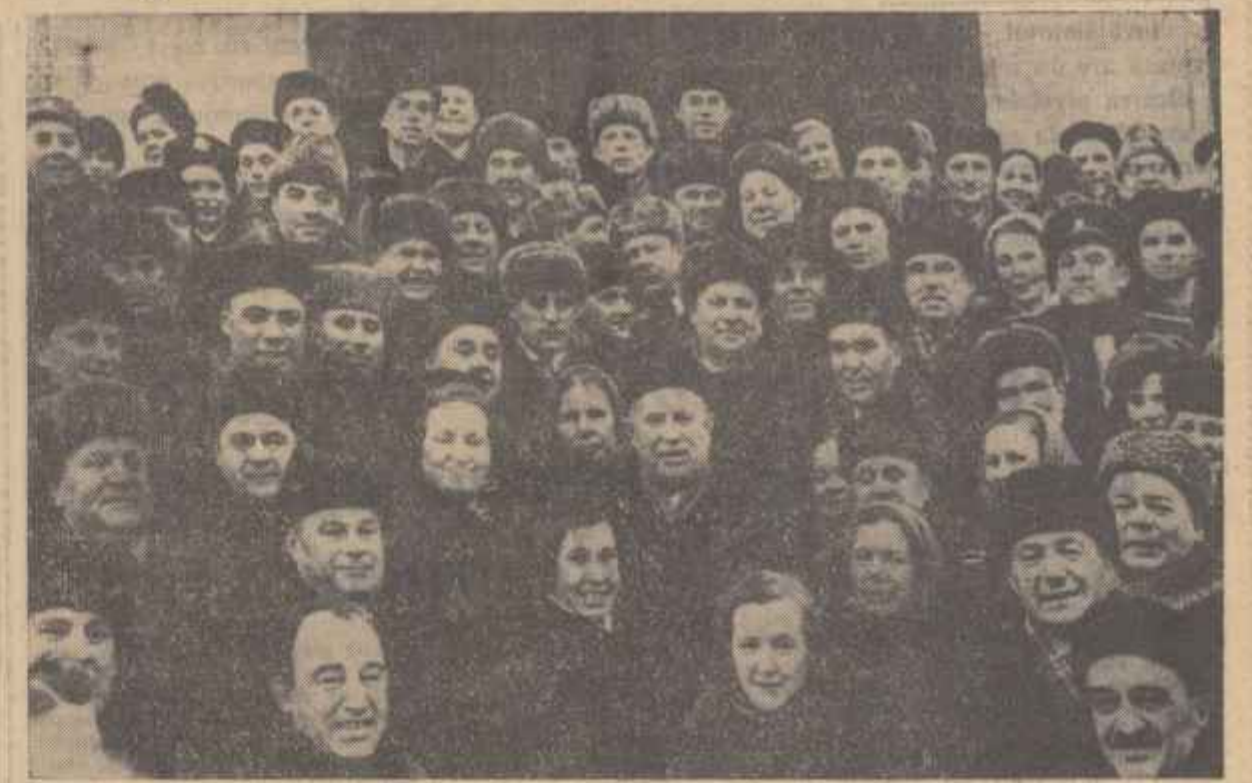
În incinta Kremlinului: N. S. Hrușciov, prim-secretar al C.C. al P.C.U.S., A. I. Mikoiian și A. I. Kricenko membri ai Prezidiului C.C. al P.C.U.S. printre delegații la Congres.