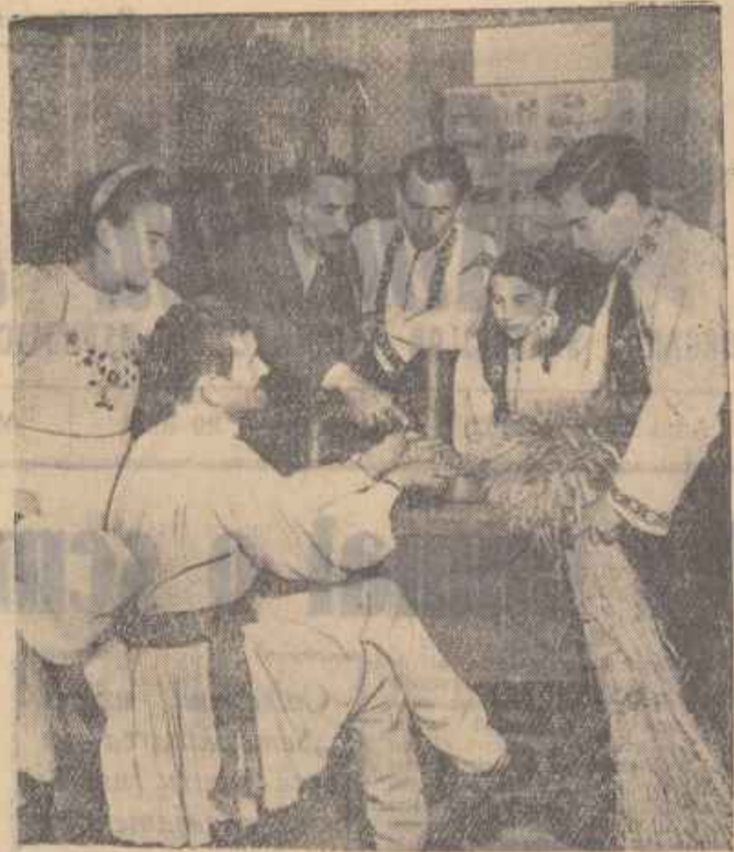
Pentru a-și însuși temeinic știința agricolă, colectiviștii de la gospodăria „I. L. Caragiale” din Rîmnic, regiunea Stalin, îmbină cunoștințele teoretice predate la cursuri cu munca de laborator. În clipa: La casa laborator a gospodăriei, un grup de colectiviști romîni și germani fac probe asupra calității semințelor.