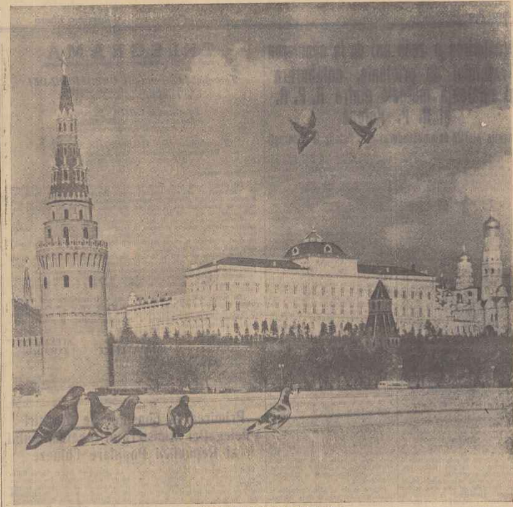
Moscova, Vedere parțială a Kremlinului.