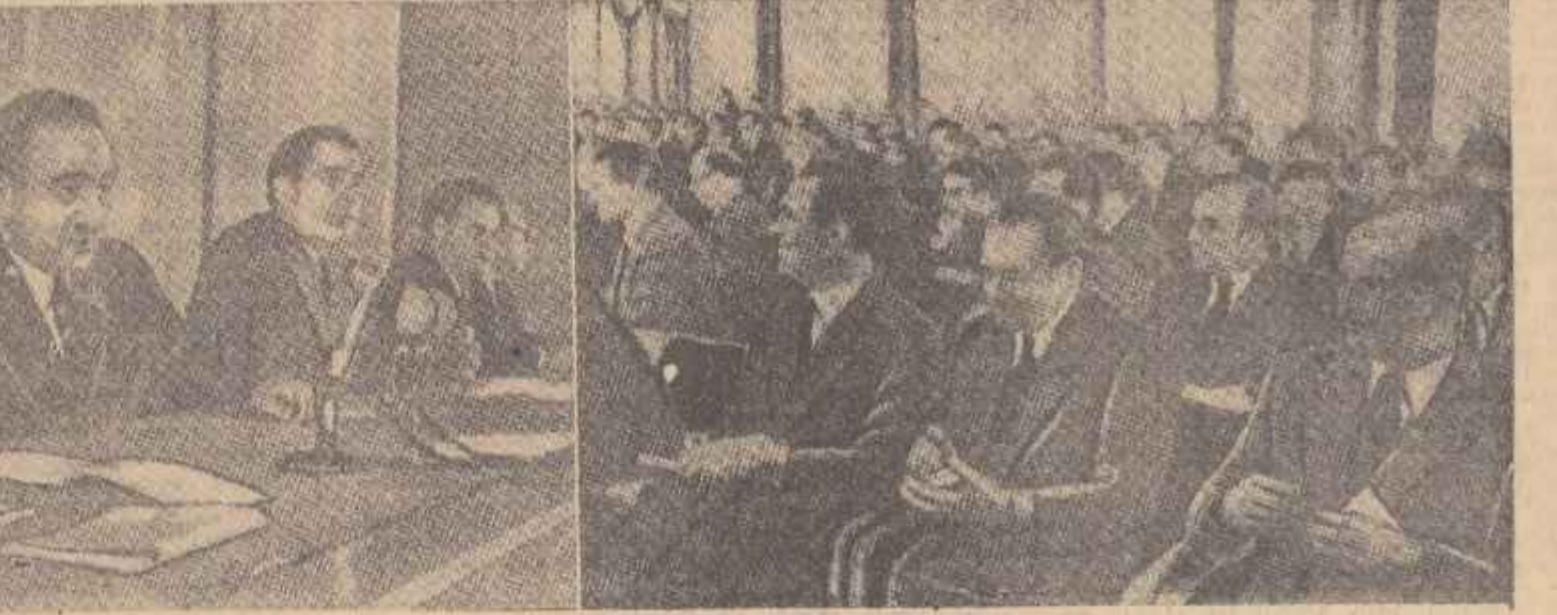
Aspect de la conferința de presă de la Kremlin

Impresia mea este că criza din toamna anului trecut în relațiile dintre Finlanda și Uniunea Sovietică a fost mai adîncă decît am înțeles noi. Din punctul nostru de vedere trebuie să considerăm drept un eveniment fericit că ea a putut fi soluționată în cursul unor convorbiri politice deosebite ce s-a încheiat prilejului favorabil pentru aceasta. Subliniind că Uniunea Sovietică doște în mod sincer să rezolve criza în relațiile dintre Finlanda și Uniunea Sovietică, U. K. Kekkonen a spus: „Ultimelme cuvinte A. I. Mikoian le-a roșit în limba engleză și rusă).