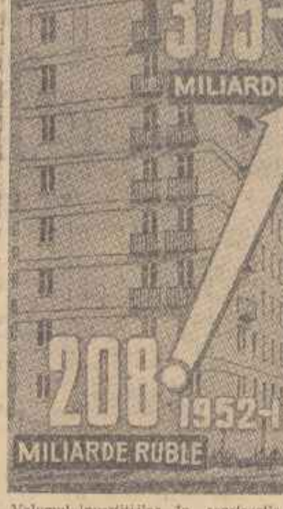
Volumele investițiilor în construcția de locuințe și lucrări militare.

comuniste, în mările rezultate obținute în cursul anului 1958 se vede clar că posibilități uriașe are poporul nostru pentru atingerea țelului propus.