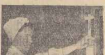
Fabrica „Dezobirea” din Orașul Ștefan cel Mare...

Dar, sîngele este un produs biologic și nu un medicament care se poate fabrica. Singura sursă disponibilă de a-l obține este că el să fie donat.