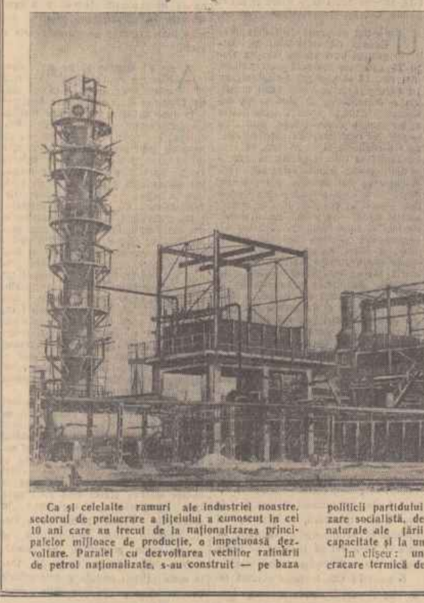
Ca și celelalte ramuri ale industriei noastre, sectorul de prelucrare a șteiului a cunoscut în cel 10 ani care au trecut de la naționalizarea principalelor mijloace de producție, o impetuoasă dezvoltare. Paralel cu dezvoltarea vechilor rafinării de petrol naționalizate, s-au construit — pe baza