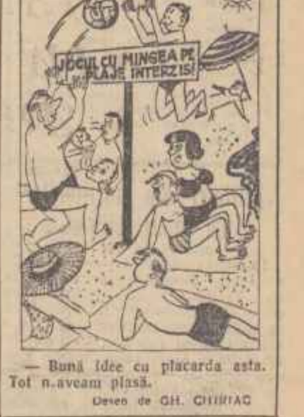
Bună idee cu placardul asta. Tot n-aveam plășă. Desen de GH. CHIHIAC