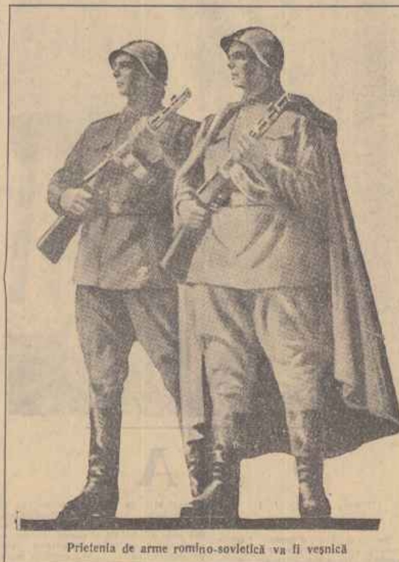
Prietenia de arme romino-sovietică va fi veșnică