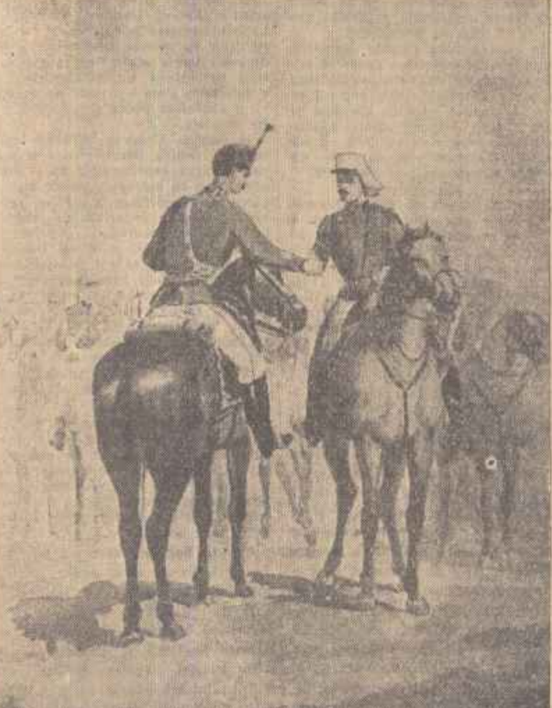
INTILNIREA S. Henția 1877