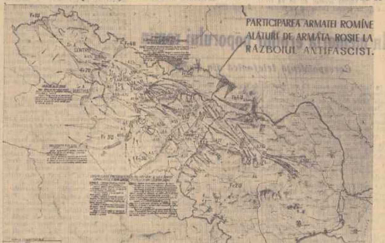
PARTICIPAREA ARMATEI ROMINE ALĂTURI DE ARMATA ROSIE LA RĂZBOIUL ANTIFASCIST.