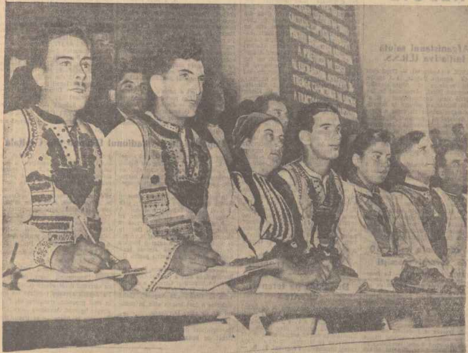
Un grup de țărani din regiunea Stalin urmărește cu atenție desfășurarea lucrărilor Confătăturii