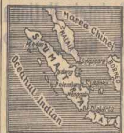
creșdere, TRUPELE GUVERNULUI CENTRAL AL INDONEZIEI AU DEBARCAT PE COASTELE SUMATREI.

DJAKARTA 10 (Agerpres). — După cum anunță agenția Associated Press, referindu-se la o șarjă demoralizantă de la