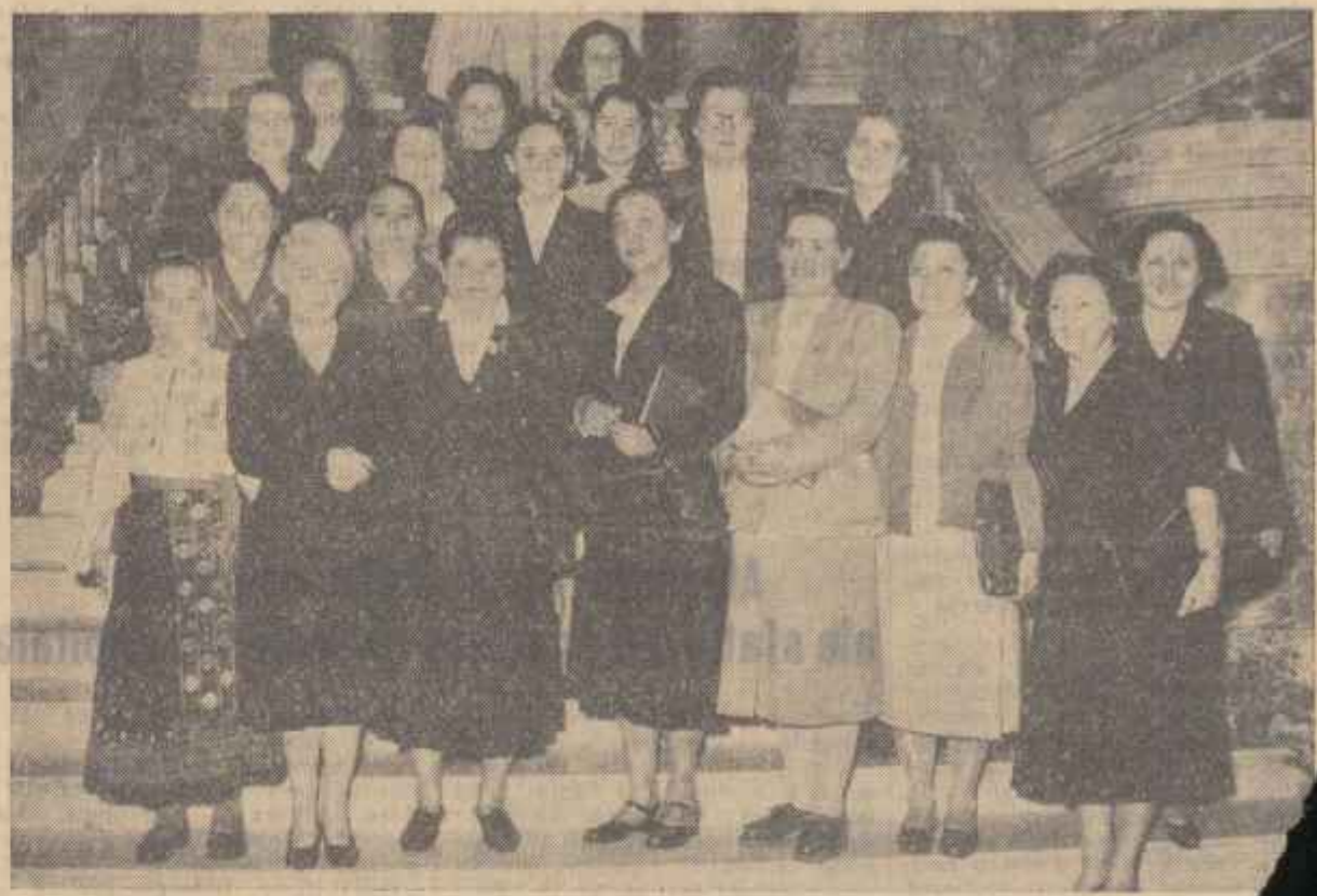
O parte din Comitetul Executiv al Consiliului Național al Femeilor din R.P.R.