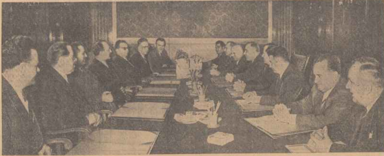
Membrii delegațiilor guvernamentale și de partid română și ungară în timpul convorbirilor.