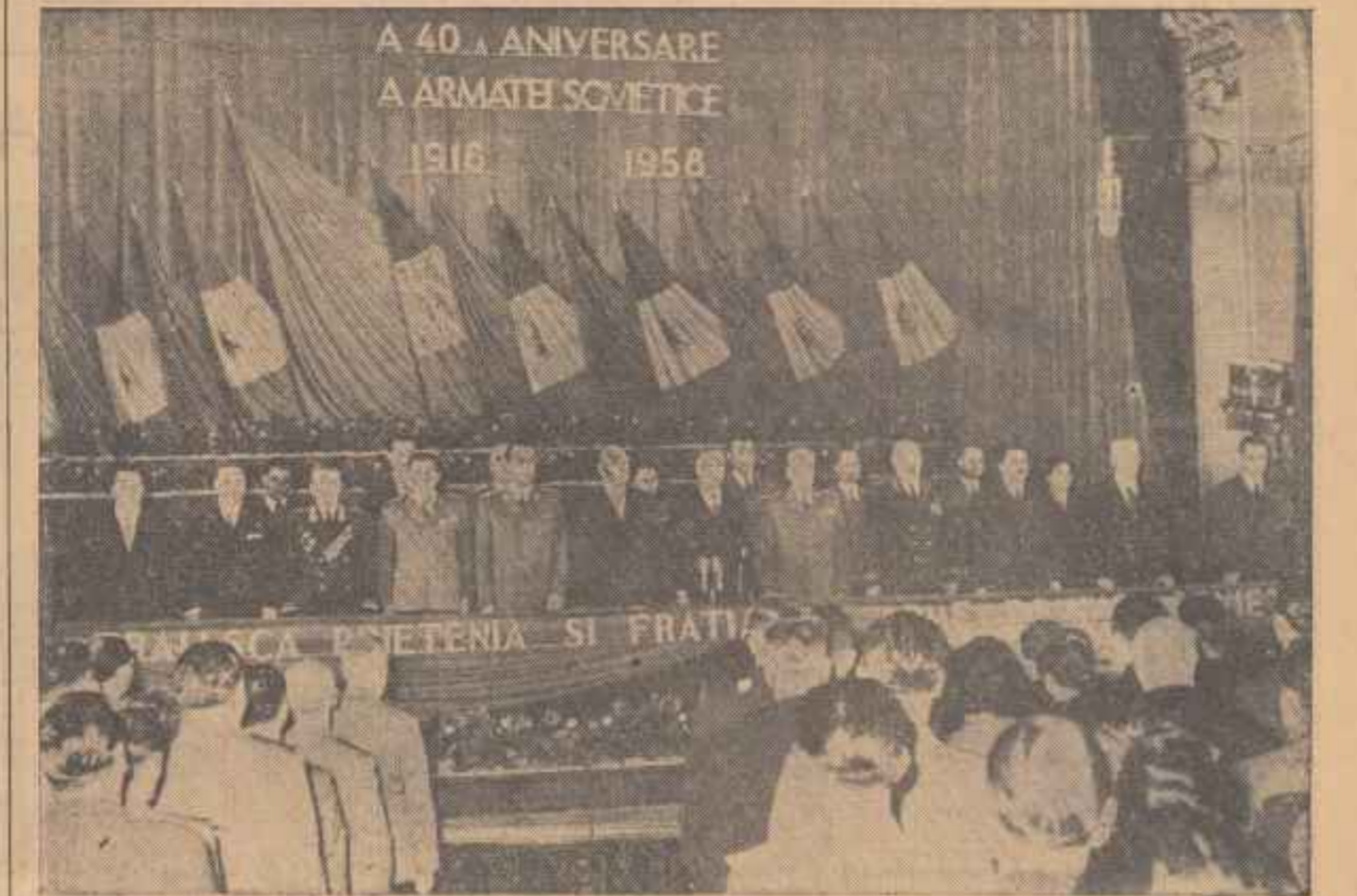
Prezidiul adunării festive organizată cu prilejul celei de-a 40-a aniversări a Armatei Sovietice.