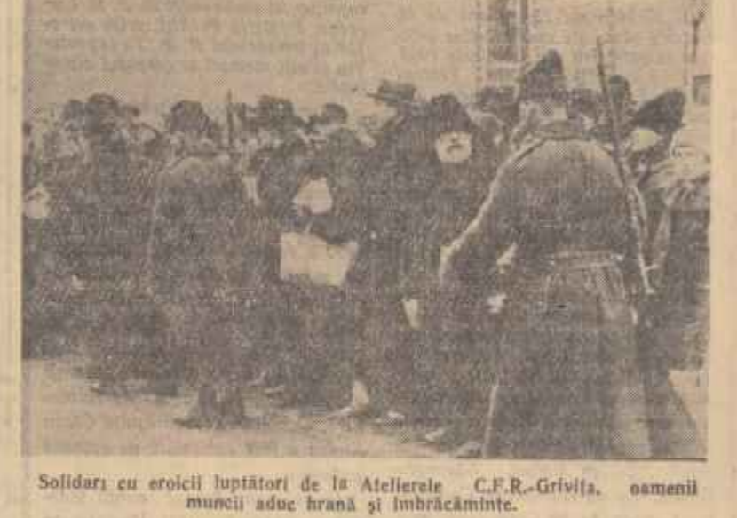
Soldarii cu eroicii luptători de la Atelierele C.F.R.-Grivița, oamenii muncii aduc hrană și îmbrăcăminte.