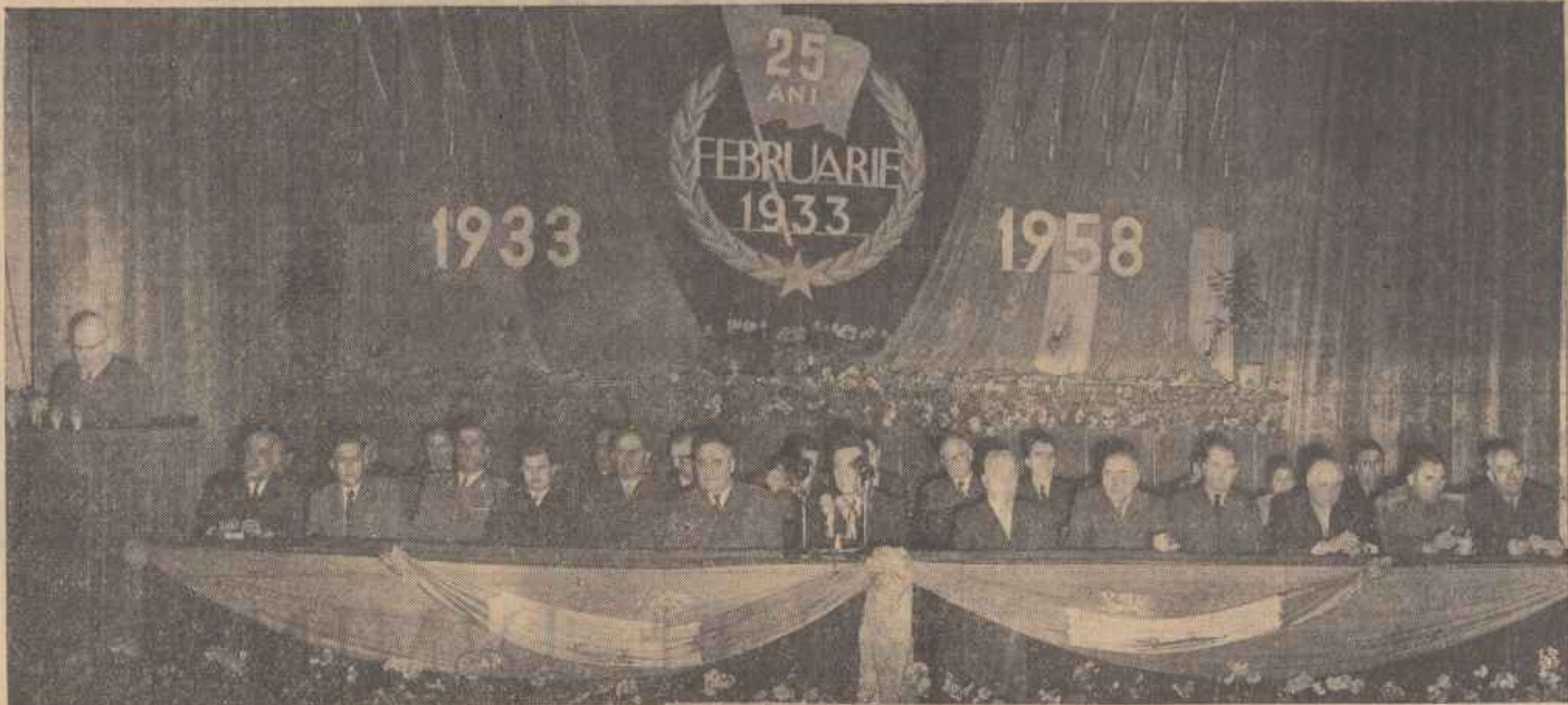
Prezidiul adunării festive de la Teatrul C.F.R. Giulești din Capitală