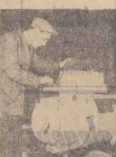
La uzinele „Clement Gottwald” din Capitală se fabrică pe scară industrială numeroase produse noi...