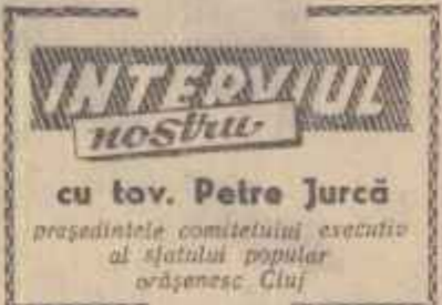
cu tov. Petre Jurcă președintele comitetului executiv al statului popular românesc Cluj