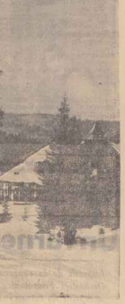
Stațiunea climaterică Stîna de Vale din regiunea Oradea, oferă și în timpul iernii prin frumusețea vestită a peisajului și aerul proaspăt al regiunii, clipe de rează desfășurare turistică și oamenilor muncii sosiți aici în concediu.