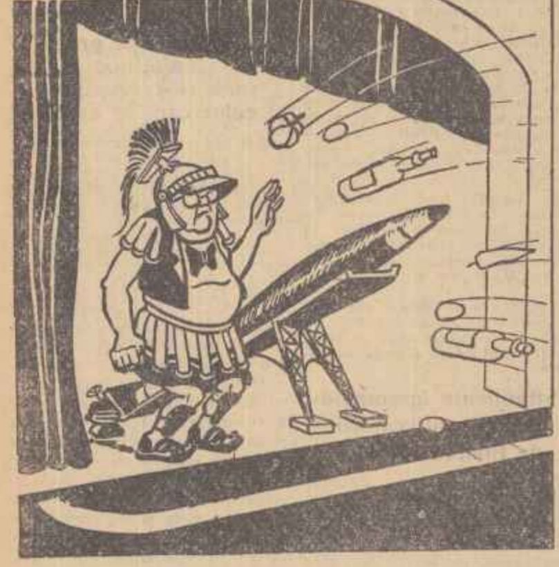
Dulles la „rampă”... Desena de I. DORU

nante de a permite Statelor Unite să construiască baze pentru rachete în Tailanda. Ziarele „SANSERI”, „SATIENRAPAP”, „DAILY MAIL” și altele publică la 11 februarie declarațiile unei serii de deputați ai parlamentului —