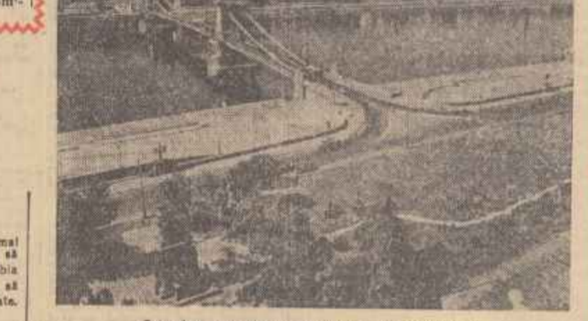
O vedere a podului sus pendat din Budapesta

Pe căile ferate ale R. D. Germane a fost pusă în circulație o jumătate de gar-vagone, alcătuită din cinci vagoane, a unui tren articulat etajat. Acest tren de călătorie este construit după principiul cu totul nou și este unic în felul său. Spre deosebire de trenurile etajate care se construiesc în trecut, cutiile vagoanelor noului tren nu au boghiori, cu excepția capetelor exteroare ale primului și ultimului vagon. Celelalte capete ale cutiilor primului și ultimului vagon, precum și cutiile vagoanelor din mijloc se susțin pe oarcum de elemente de întărire ale șinelor, care sînt înalte și care asigură alinierea și care asigură înălțimea și poziția înălțată a trenului în curbe și în punctele de schimb de direcție.