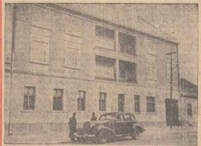
Ultimul cîșeu reprezintă unul din blocurile nou construite prin grija statului popular al Orașului Stalin. În ultimii doi ani, circa 1000 de familii s-au mutat în apartamente nou construite sau reamenajate.