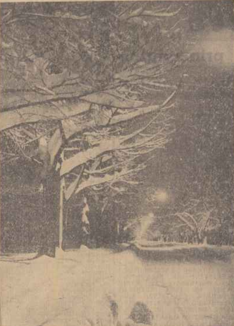
Pe gheoașă Kiseleff din Capitală