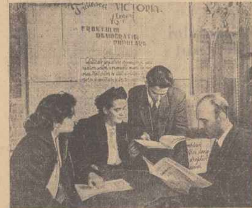
Zilele acestea, cetățenii Capitalei se prezintă la centrele special amenajate, pentru a verifica dacă sînt înscrși în listele de alegători. În clipa: Un aspect de la centrul Nr. 1 de aflare a listelor de alegători din raionul N. Bălcescu din Capitală.

Sume importante drept premii de vechime au primit și muncitorii de la uzinele „Gh. Gheorghiu-Dej” Bala Mare, „21 Decembrie” Copșa Mică, „I Mai” — Fernezu și din alte întreprinderi ale industriei chimice. (Agerpres)