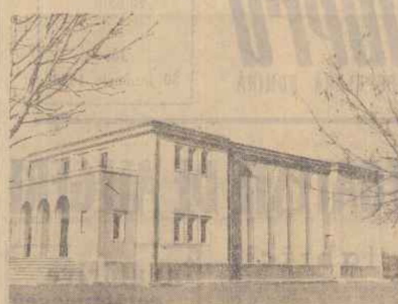
Printre realizările obținute de statul popular al raionului Gh. Gheorghiu-Dej din Capitală, se numără și un nou cinematograful situat în cartierul Militar, care are o capacitate de 300 de locuri.