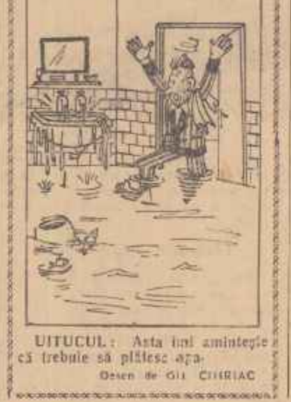
Uitucul: Asta îți amintește că trebuie să plătești apa. Desen de GIL CHIRIAC.