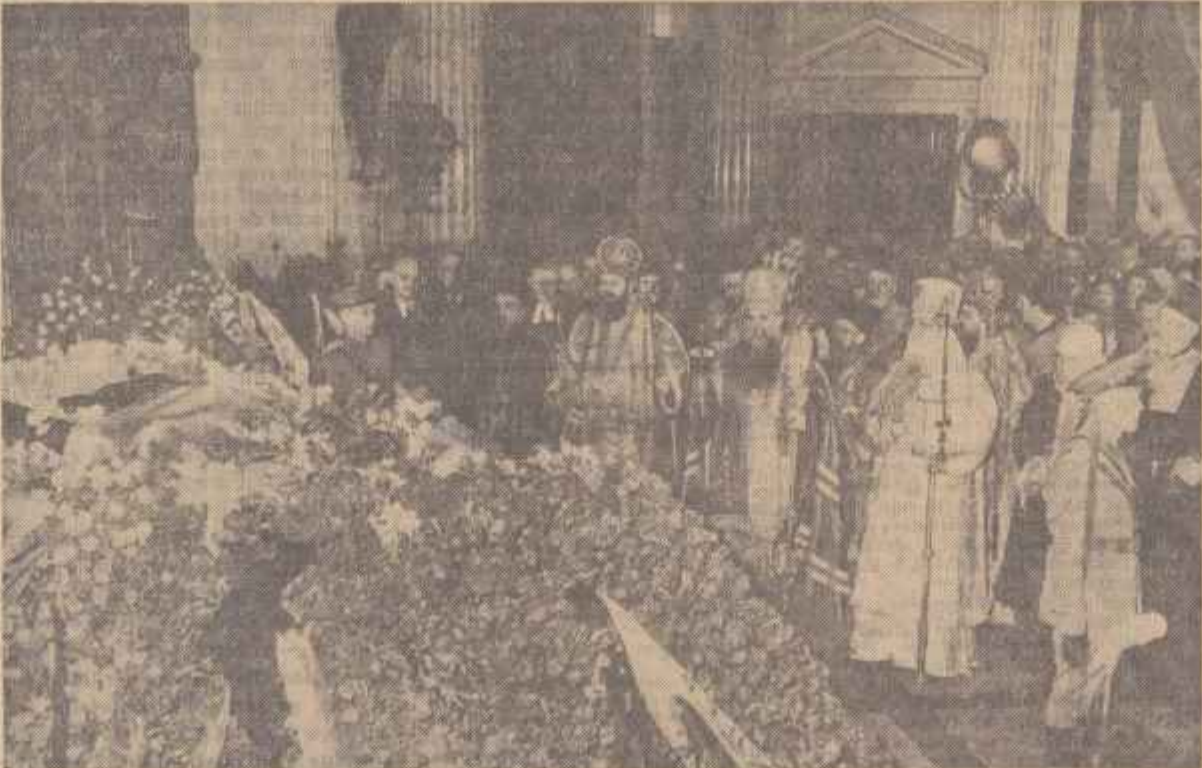
Slujba religioasă de la Palatul Republicii