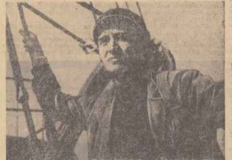
O scenă din film.