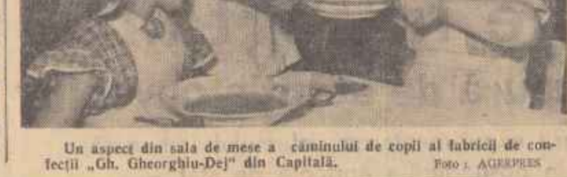
Un aspect din sala de mese a cîmînului de copii al fabricii de confecții „Gh. Gheorghiu-Dej” din Capitală.

care l-a depas în sufletul său viața de birocaut, mai străbute încă o scorbură chinătoare spre dragoste și căsătorie, exprimată, evident, tot în termenii mecano-funcționării. Femeia, o zărită și-o și-a pierdut însă prospectiva sufletească și bunul simț și după ce descoperă travagiile ireparabile ale dezumanizării funcționării asupra fostului său iubit, îl va smulge însă masca jalnică comică de pe figura birocratului fivins.