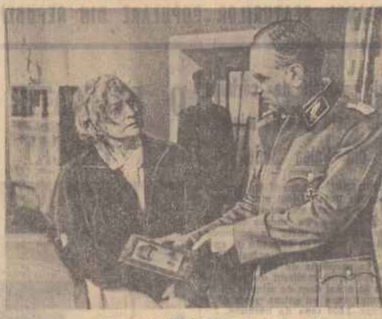
Scenă din filmul „Disparut fara urma”.

Există o tradiție a literaturii sovietice în a zugrăvi marile evenimente istorice receptate prin optice omului simplu. De-a lungul a patru decenii, această tradiție s-a amplificat, literatura dobîndind astfel capacitatea de a exprima coloșalele profacții de conștiință care au avut loc în viața ilustruă a omului sovietic.