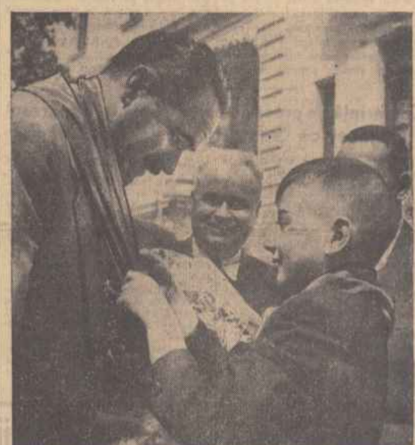
Delegația parlamentară iugoslavă în vizită la Palatul Pionierilor