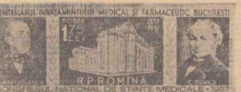
CENTENARIUL ÎNVĂȚĂMÎNTULUI MEDICAL ȘI FARMACEUTIC BUCUREȘTI