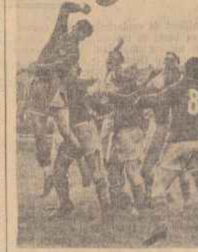
O țază din joc.