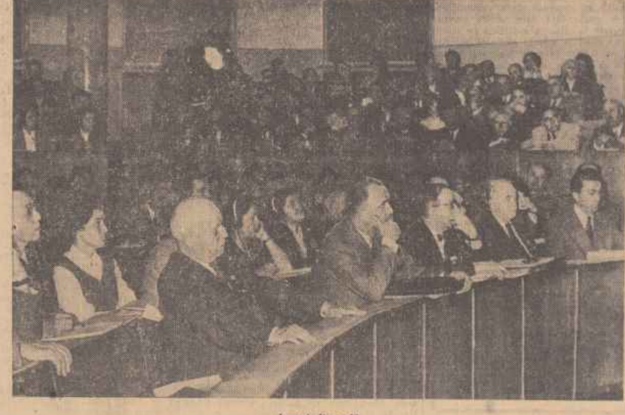
Aspect din sală

La 5 mai s-au deschis la București lucrările primului Congres național de științe medicale din Republica Populară Română.