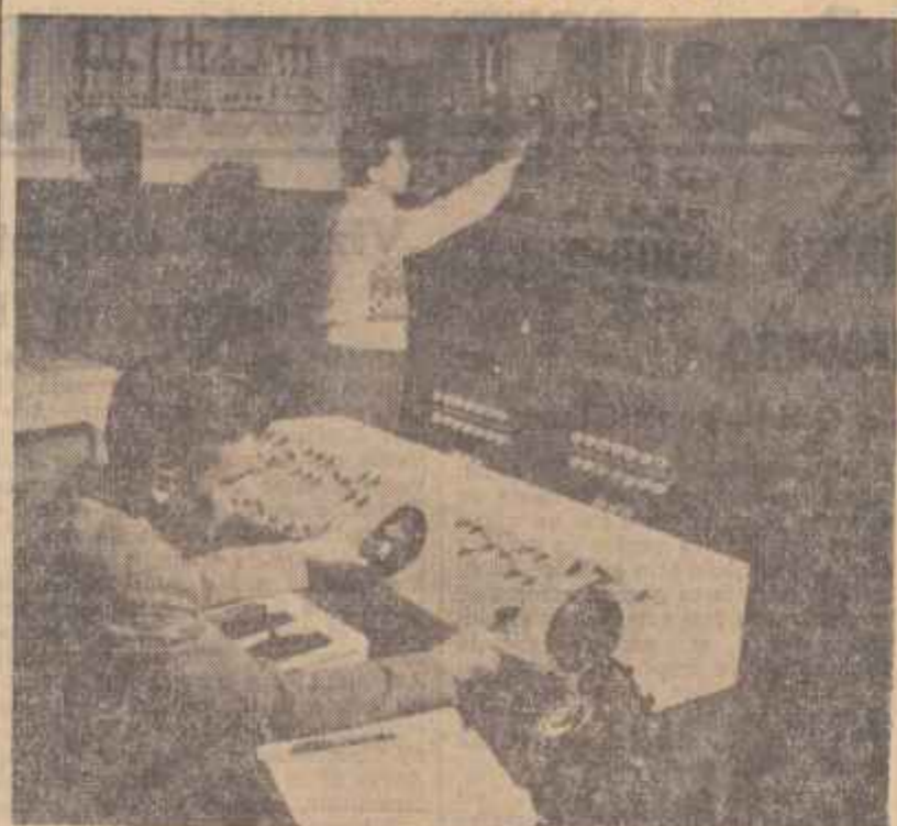
Impună cu celelalte popoare ale lagărului socialist, poporul nostru sărbătorește astăzi Ziua radiofoniei...