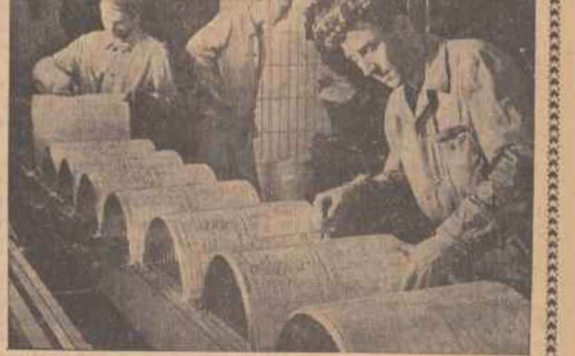
turnată în plumb (fotografia nr. 3). De aici, pe bandă rulantă, paginile sau arzoșii rotative, unde ziarul iese gata tipărit, împachetat și numerotat, gata pentru a ajunge cit mai repede în mîinile cititorilor (fotografia nr. 4).

După aceasta rîndurile de plumb sînt cu pricepere puse în pagini de harnicii paginător (fotografia nr. 2). Apoi, după matrițarea paginii, matrița ajunge în secția de stereotipie, unde este