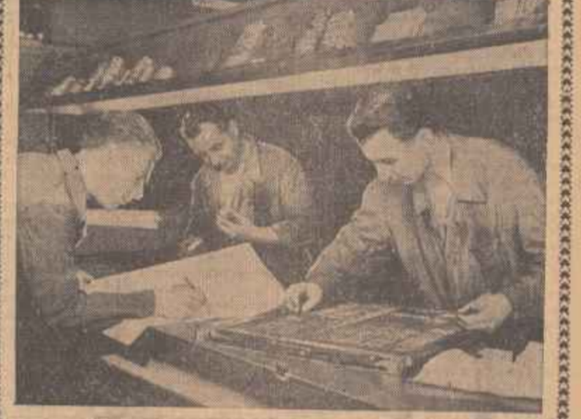
ruul, El a trecut prin câteva secții de la Combinatul „Casa Științei”, înzestrat cu un modern aliaj sovietic.

Într-o asemenea noapte reporterul nostru fotografic a urmărit drumul pe care îl parcurge cuvîntul spre împlinirea tiparului.