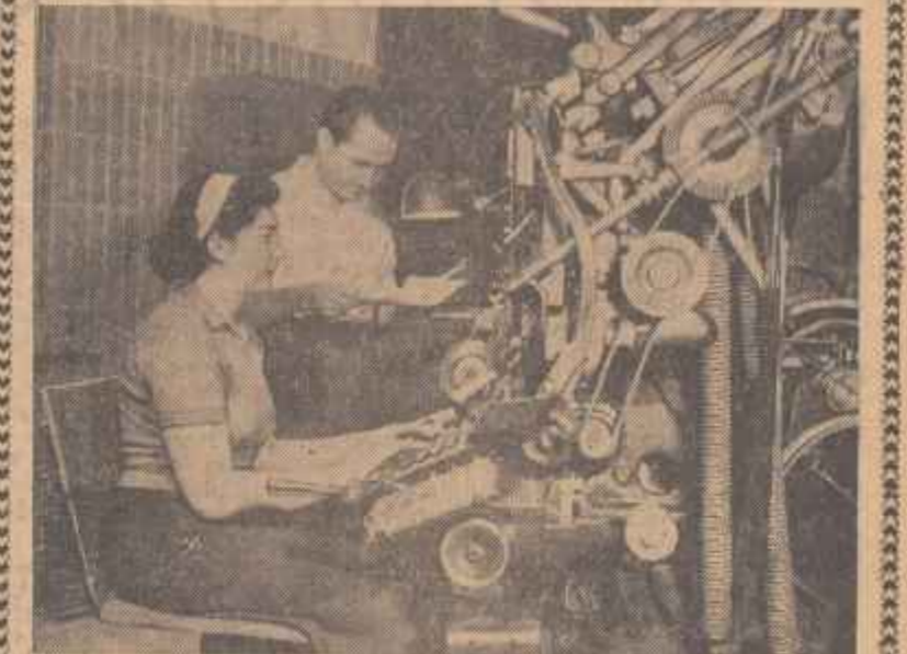
supra meselor de lucru, trudesc cu pasiune pentru ca în zorii zilei, cuvîntul tipărit să în drumul orașelor și satelor îndepărtate. Atunci vei înțelegi mai bine, cititorule, farima de bucurie ce rodește în inimile acestor oameni, anonimi care, mereu la datorie — în țara sau stră — își îndeplinesc neștiut, nobilul lor îndatorire.

A apărut ziarul L. În fiecare dimineață, cititorule, ziarul lăbit cu literele proaspete încă, sub cerneală, te întâmpină înfrîntîndu-ți vești de pretutindeni, aducînd în fiecare usină, în fiecare sat, și în fiecare casă cuvîntul vesnic viu al partidului. Te-ai gândit vreodată că drumul parcurge toată această de ziar pe care o cuprîngi cu atîta nerăbdare în fiecare dimineață? Poate că da... În nopțile tiraj, lucrătorii tipografilor, oplecați de-