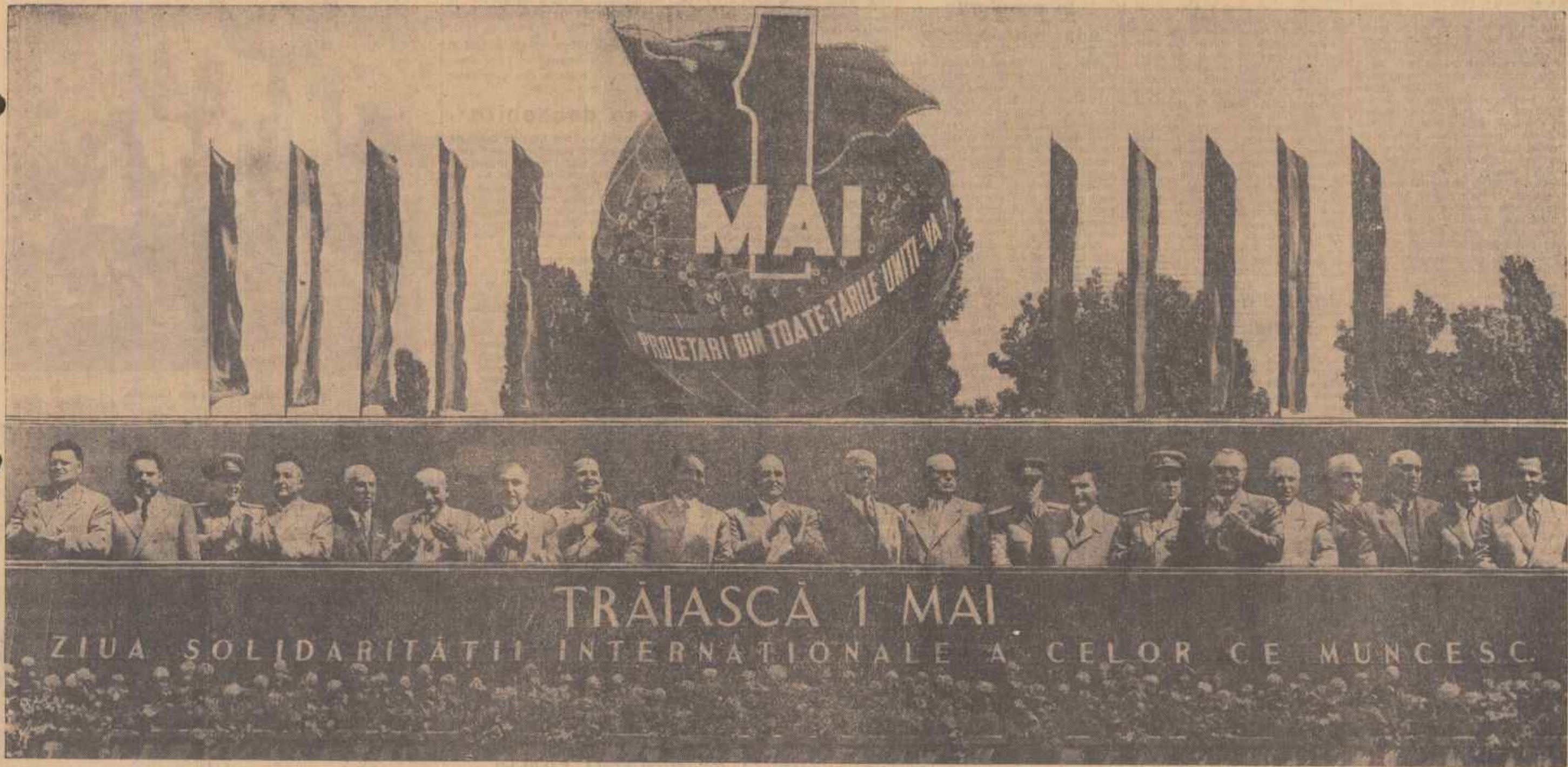
Un aspect al tribunei centrale din Piața „I. V. Stalin” în timpul demonstrației oamenilor muncii.