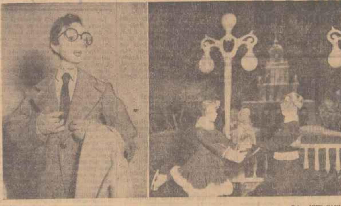
Scene din spectacol