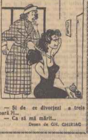
— Și de ce divorțezi a trei ori? — Ca să mă mărit... Desen de GH. CHIRIAC

La unele instanțe judecătorești se prezintă cereri de divorț neînsemnate.