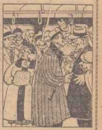
Punctul pe i — De ce se ceartă? — Vor să se convingă că trebuie să-și vorbească politicos! — Desen de GIL CHIRIAC

Profesorii și învățătorii sînt obligați să organizeze în perioada de pregătire a examenelor care de consultație, de recapitulare, etc.