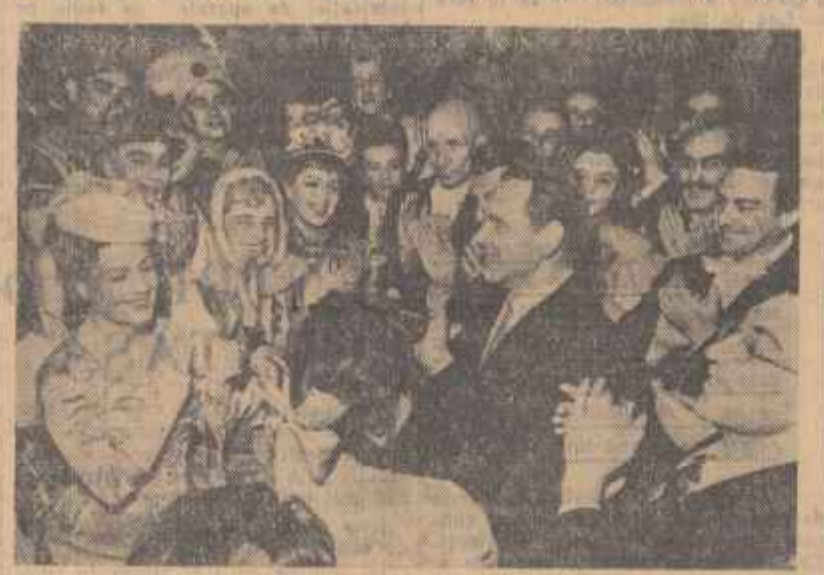
După cum se știe, spectacolele la Moscova ale Teatrului de Stat de Operetă din București se bucură de un frumos succes. Cheluz pe care-l reproducem înfățișează pe N. Mihailov, ministrul Culturii al U.R.S.S., în mijlocul artiștilor români după reprezentarea operetei „Lăsați-mă să cânt”.