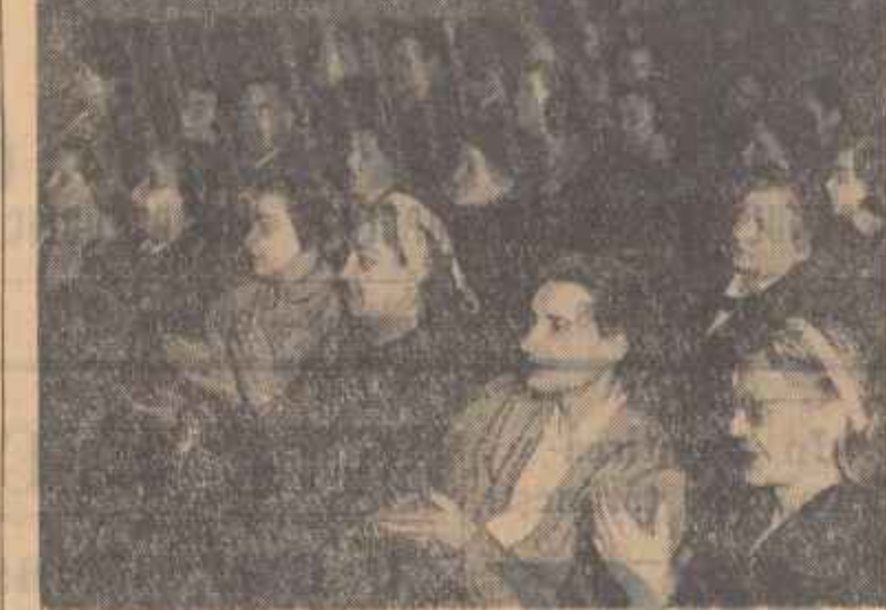
În cinstea zilei de 8 Martie, sfatul popular al raionului „I. Ma” din Capitală a organizat duminică 3 martie la Teatrul Satiric Muzical „C. Tănase”...