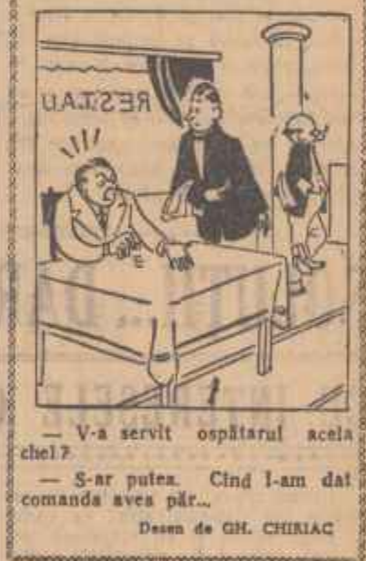
— V-a servit ospătarul acela chel? — S-ar putea. Cînd l-am dat comanda avea păr... Desen de GH. CHIRIAC