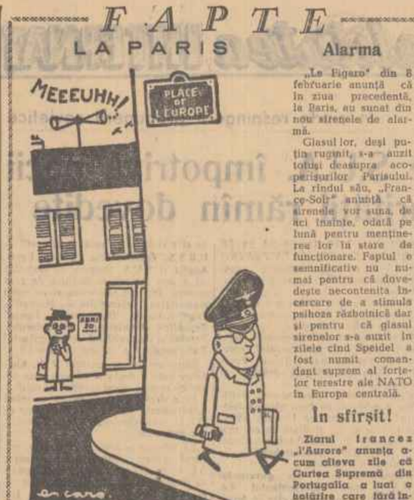
— Aceasta lui aminteste de anumite întîmplări. (Prezintă din ziarul „LIBERATION”).

Revista urugviană „Gazeta de cultură” a publicat un supliment la numărul său din noiembrie—decembrie 1956, intitulat „Prezentarea Romînilor”. Suplimentul conține un articol scris de Alfredo Gravina despre orașul București, pe care autorul îl numește „orașul grădinarilor”. Impartășindu-și impresiile din călătoria făcută în țara noastră, autorul subliniază importanța întîmpinării avute cu numeroase personalități culturale române și străine și viziunile ce s-au făcut la diferite instituții culturale românești.