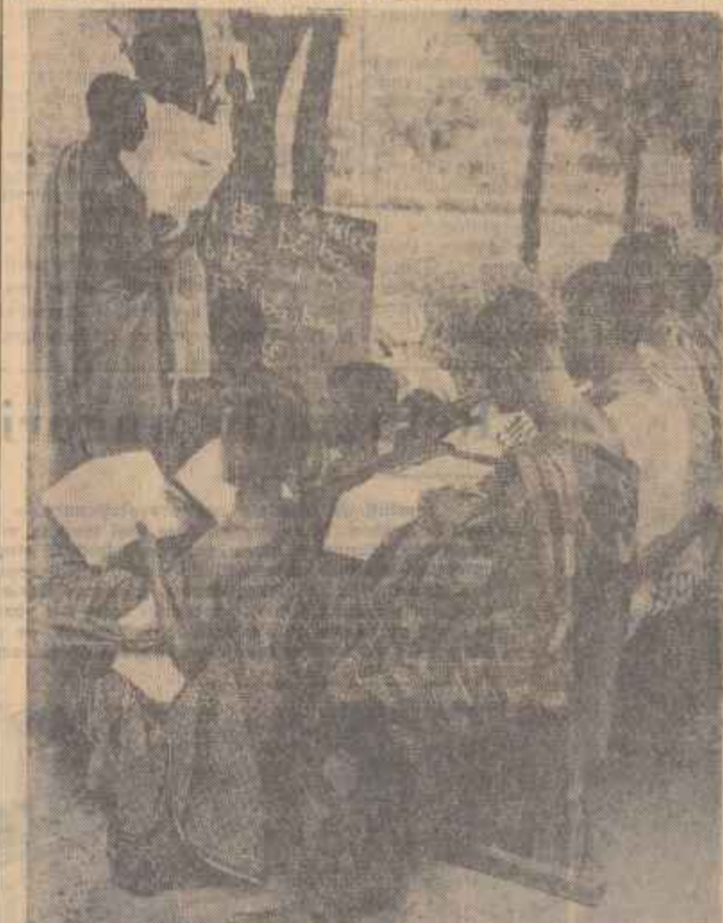
La umbra copacilor o clasă mîndă de copii și adulți face programe excelente, instruiți fiind de un băștinan care a studiat la școala tehnică din Luback.

Coasta de Aur își recapătă independența după secole de subjugare colonială. Această veste care a bucurat opinia publică a fost dată publicității acum cîteva luni. De atunci s-a desfășurat complexa procedură a trecerii legii pentru acordarea independenței Coastei de Aur prin parlamentul britanic. Astfel începe să-și pună semnătura pe respectiva lege, reșina Angliei. Între timp au devenit cunoscute unele amănunți în legătură cu organizarea noului stat african. Numele acestui nou stat va fi GHANA. Acesta este numele pe care l-a purtat un puternic stat african existent în evul mediu pe cursul superior al fluviului Niger și Senegal. Denumirea de pînă acum — Coasta de Aur — datează de prin secolul al XV-lea, cînd portughezii au descoperit