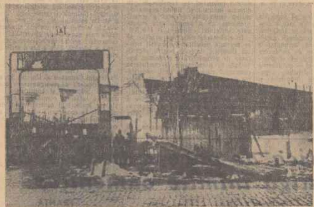
Atelierele Grivita, după reprimarea sângeroasă a eroice lupte a muncitorilor cereștiți

a crescut de la 2.575.000 (1949) la 8.000.000 lei; numărul copiilor trimiși în tabere a crescut de la 50 la 800; numărul muncitorilor trimiși la casele de odihnă de la 200 la 1500, numărul muncitorilor care luau masa la cantina dietetică, înainte de război, nici unul, astăzi 400. Există actualmente un sanatoriu de noapte care îngrijeste 352 muncitori pe an, o policlinică nou creată, un staționar cu 50 de paturi, o cantină în clădirea care altădată era hală a vagoanelor regale, un frumos club cultural, etc.