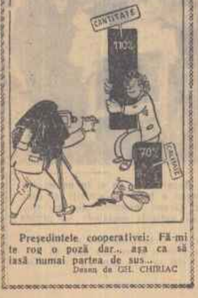
Președintele cooperativei: Fă-mi te rog o poză dar... așa ca să iasă numai partea de sus... Desău de GEL CHIRIAC

Cooperativă meșteșugărească „Ion Iacobi” din Biliac lucrează neglijent încălțăminte ce a jurn, cează comerțului de stat.