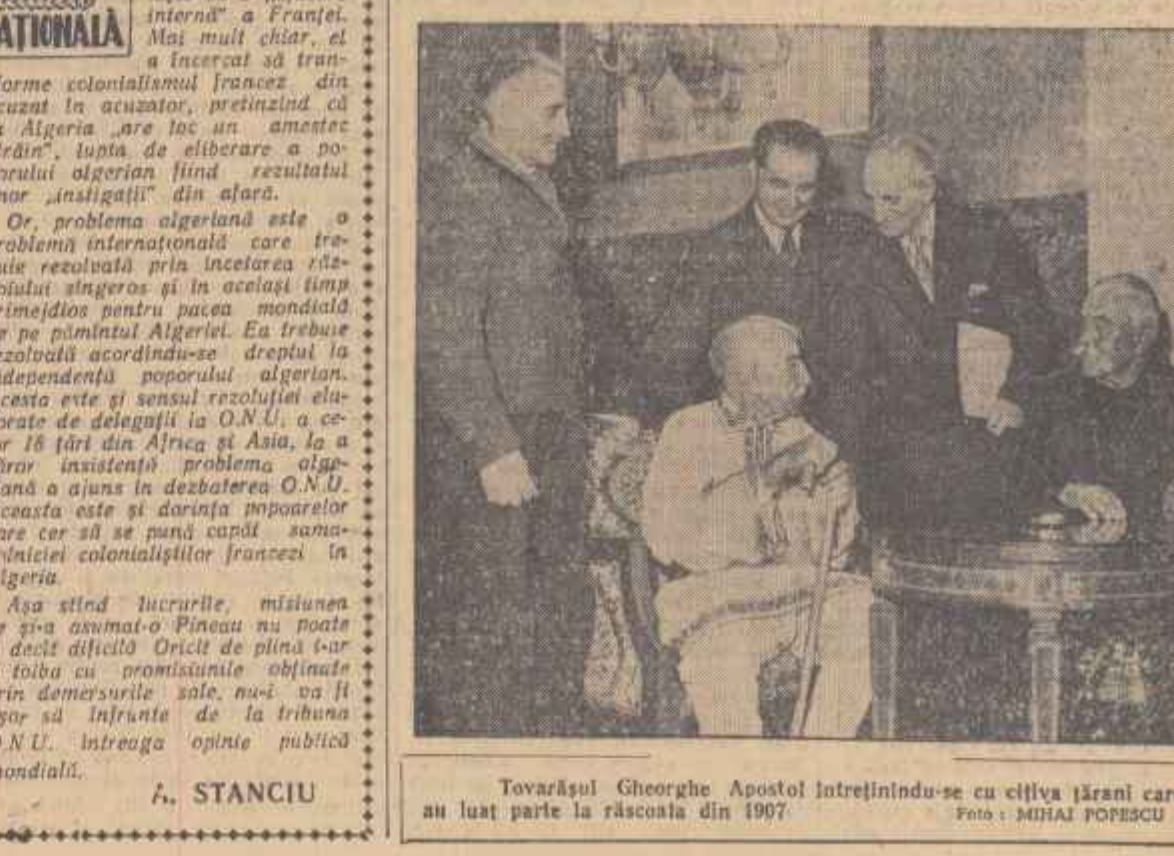
Tovarășul Gheorghe Apostol întreprindîndu-se cu citiva țărani care au luat parte la răscoală din 1907.

Miercuri după-amiază a avut loc la Consiliul de Miniștri adunarea de constituire a Comitetului Național de organizare a celei de a 50-a aniversări a răscoalelor țărănești din 1907, potrivit hotărîrii C.C. al P.M.R. și Consiliului de Miniștri.