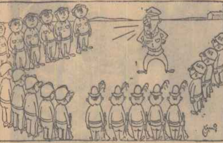
SPEIDEL: — Așa. Acum putem vorbi din nou nemțește cu dvs. Europa, dreptii!!! (Din ziarul „BERLINER ZEITUNG“)

Fostul general hitlerist Speidel, numit de curând la postul de comandant suprem al trupelor terestre N.A.T.O. din zona centrală a Europei, va avea sub comandă și trupe engleze, franceze, italiene, belgiene, olandeze și luxemburgheze.