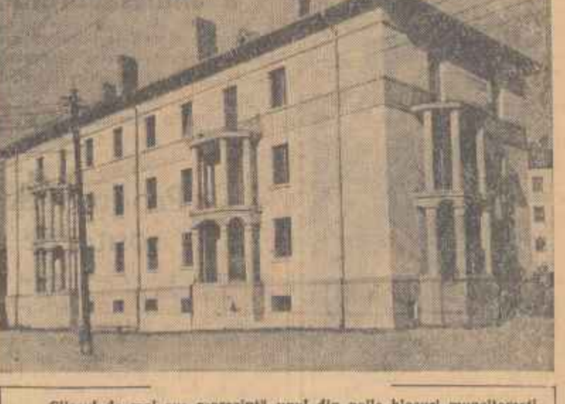
Cliseul de mai sus reprezintă unul din noile blocuri muncitorești date recent în folosință în orașul Craiova. Încă o dovadă grăitoare a atenției pe care o acordă statul nostru pentru îmbunătățirea condițiilor de viață ale oamenilor muncii.