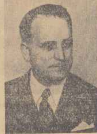
DEMOSTENE BOTEZ, laureat al Premiului de Stat...