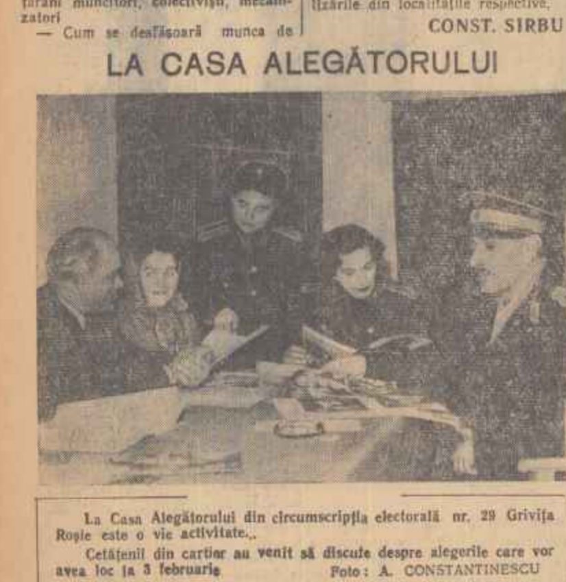
La Casa ALEGĂTORULUI din circumscripţia electorală nr. 29 Griviţa...

— Cum se desfăşoară munca de la Casa ALEGĂTORULUI