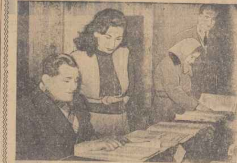
În cliseu: La centrul de afișare nr. 8 din b-dul Stații nr. 1.

De ieri dimineață s-au alinaț. În centrele special amenajate, listele de alegători. Mulți cetățeni s-au prezentat la aceste centre și au verificat listele de alegători.