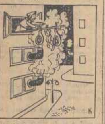
GOSPODINA: — Așa am și eu un avantaj...

Întreprinderea de locuțete și locuțuri din raionul V. I. Lenin țărănească de aproape un an de zile repararea cazanului de colorifer de la imobilul de pe str. Dr. Iatropol nr. 15.