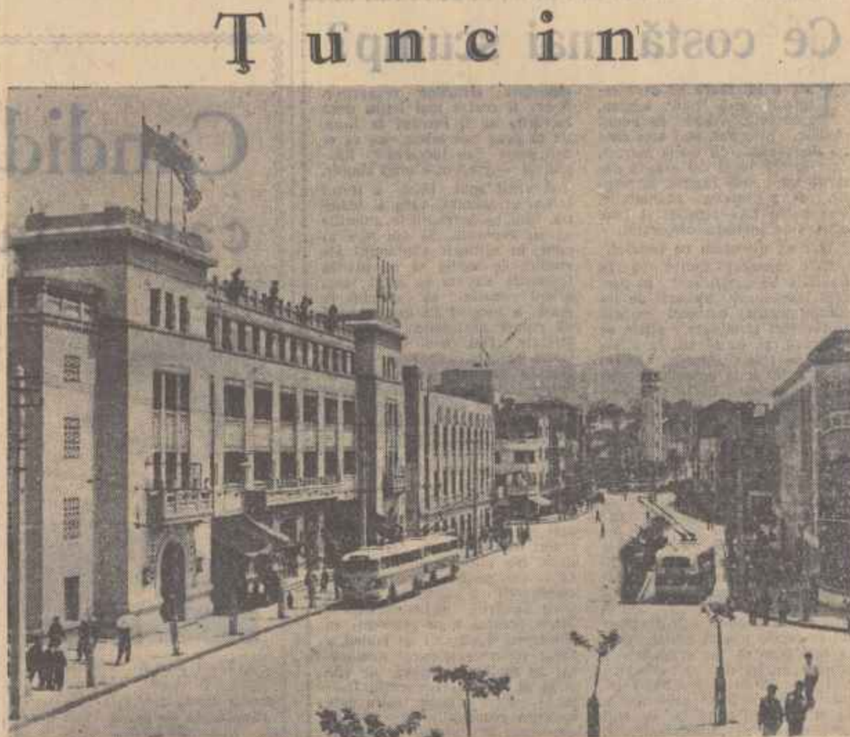
Alături de mîile de localități din marea Chină populară la care înflorește o viață nouă Tuncin, oraș cu o populație de 1.700.000 de locuitori, se poate mîndri pe drept cuvînt cu remarcabilele sale realizări obținute în ultimii ani. Prin munca neobosită deslășurată de locuitorii săi, aici a fost construit un impunător palat a cărui sală centrală cuprinde 5000 de locuri, și s-a ridicat într-un timp record, un combinat sportiv cu sală, stadion pentru 60 de

LONDRA 20 (Agerpres). — Așa-zisul „proiect de constituție” pentru insula Cipru publicat la Londra de către comisia britanică prezidată de lordul Radcliffe, a trezit indignare în rîndul opiniei publice din Cipru și în rîndul opiniei publice din Grecia. La 20 decembrie, guvernul grec a dat publicității o declarație în care respinge acest „proiect” care lasă politica externă a insulei în mîinile autorităților britanice acordînd guvernatorului britanic puteri aproape nelimitate. La Londra a avut loc o conferință