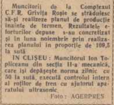
Muncitorii de la Complexul C.F.R. Grivița Roșie se străduiesc să-și realizeze planul de producție înainte de termen. Rezultatele eforturilor depuse s-au concretizat și în luna noiembrie prin realizarea planului în proporție de 109,5 la sută.

— Cîi de mult contrastează aceste relații de tip imperialist ce le întronau firmele airmine în țara noastră cu spiritul relațiilor noi, socialiste, care stau la baza colaborării noastre cu U.R.S.S. și celelalte țări socialiste? Ajutorul reciproc, sprinț activ în dezvoltarea și înflorirea economiei țărilor socialiste, aceasta este linia tradițională a legăturilor frățesci cu marea familie a țărilor socialiste. Acesta a fost și spiritul tratativilor romino-sovietice de la Moscova, pe care lucrătorii din industria noastră chimică, alături de întreg poporul muncitor le-au salutat cu adîncă satisfacție.