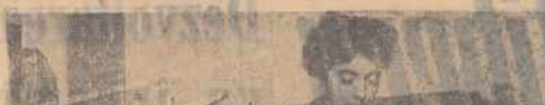
Un film care înălță și greș coștii de aparență și de iluzii, ca să se vadă cum nu se poate mai limpede, reversul întinșat al unei organizații sociale, învechită în realitate.

Ziua în amiază mare, între cunoscuți și prieteni, în mijlocul unui urias furnicar de lume, un om se zbate nepuțincios și dezamăgit, între ghimbecul ucigașilor științi de nobre Victoria se răzvrățește, lipsă în gura mare, se luptă pe viață și pe moarte dar strigătează, în abuzul de nepăsare tuturor, rîmni fără socu, iar viața își continuă melancolicul mersu, ca sub semnul marilor fatalități.