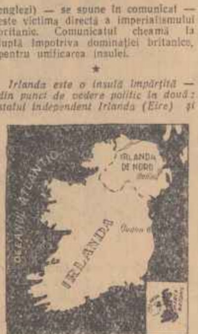
Irlanda de nord care intră în componenţa Regatului Unit al Marii Britanii şi al Irlandei de Nord.

LONDRA 13 (Agerpres). — În Irlanda de nord au fost scumulate în ultimele zile incidente de o gravitate deosebită. Sînti aparute în ziare anunţuri că între grupuri înarmate din rîndul populaţiei şi poliţiei au avut loc schimburi de focuri. În comitatul Londonderry au fost avariate două poduri; clădirea postului de radio B.B.C. a fost avariată de explozia unei bombe; au fost atacate cazărmi şi clădirea tribunalului. Din relaţiile presei rezultă că atacurile au fost organizate de către „armata republicană irlandeză” care luptă împotriva diviziunii Irlandei. Ca urmare a acestor incidente, în Irlanda de nord a fost decretată starea de alarmă şi au fost operate numeroase arestări. Ministrul de război al Marii Britanii, John Hare, a anunţat în Camera Comunilor că o comisie militară va ancheta incidentele produse. Partidul nord-irlandez „Sinn Fein” care are doi deputaţi în parlamentul de la Londra s-a declarat solidar cu ceea ce el numeşte „răscoală împotriva agresiunii britanice”. Cartierul general al armatei republicane irlandeze a publicat la Dublin, rapita la statului Eire, un comunicat în care declară că „rezistenţa împotriva dominaţiei britanice în Irlanda ocupată a intrat în faza bolnăritoare”. Populaţia din cele şase comitate (adică din Ulster — ocupat de