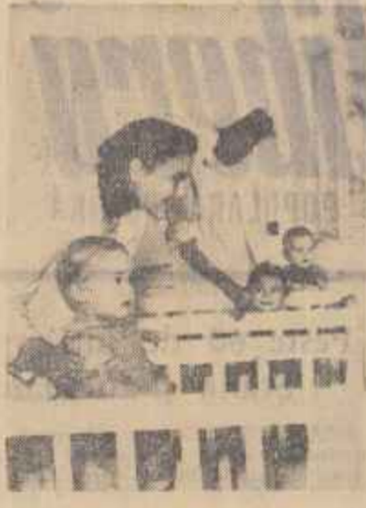
În patria noastră copiii sunt înconjurați cu multă grijă și dragoste. Pentru sănătatea și educația lor statul democrat-popular cheltuiește mari sume de bani...