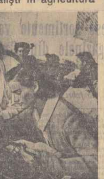
Studentii și studentele Institutului Agronomic din Cluj...