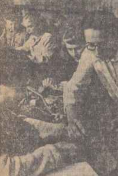
Studentii și studentele Institutului Agronomic din Cluj...