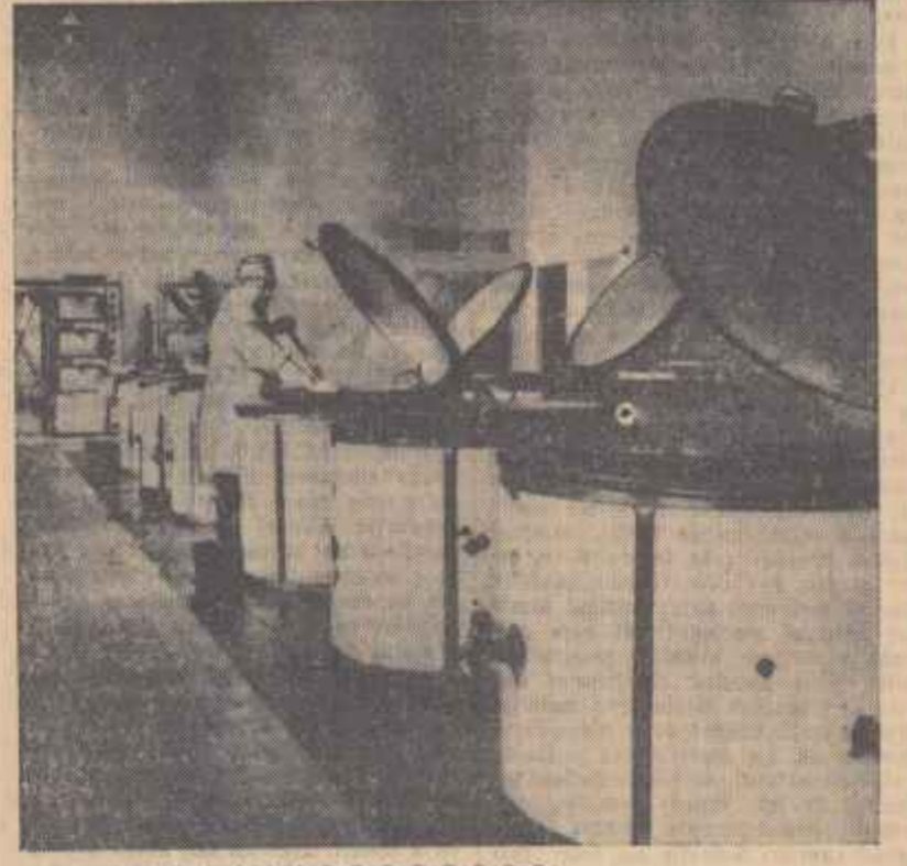
Reportajul nostru vizitînd zilele acestea cîteva cantine din Capitală, cu scopul de a surprinde preocuparea ce există pentru buna funcționare a cantinelor, pentru asigurarea unei mese consistente, pregătută cu grijă și lefină, la dispoziția salariaților. Obiectul constatărilor lor îl formează reportajul „Gospodari și... „gospodari”, ce-l publicăm în pagina a 11-a. În cilșee: (stînga) în bucătăria modern utilată a cantinei fabricii