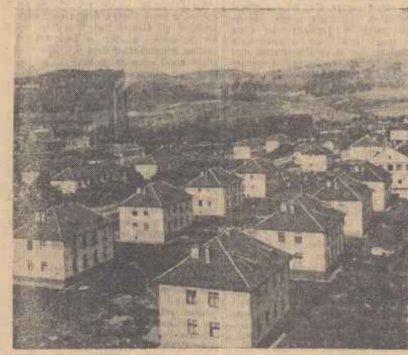
Grija partidului și guvernului nostru de a asigura condiții de trai din ce în ce mai bune oamenilor muncii se vedește și din faptul că mai în toate colțurile țării se construiesc mereu noi cartiere de locuințe muncitorești.