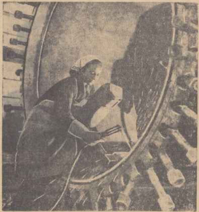
În aceste zile de întrecere avîntată, munca în secția cazangeriei a uzinelor „Mao Tse-tun” din Capitală cunoaște o mare însușire. Aici se lucrează printre altele o serie de autoclave necesare industriei chimice.