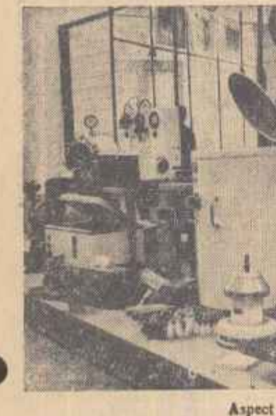
Aspect de la expoziție.

Încă din prima zi, expoziția „Industria mecanicii fine și medicinii din R.P. Ungară” deschisă în sala din B-dul G-ral Magheru nr. 21 a cunoscut o mare afluență de vizitatori. Prin produsele prezentate de patru întreprinderi de comerț exterior, expoziția constituie un minunat prilej de trecere în revistă a realizărilor dobîndite în ultimul timp de industria maghiară de mecanică și instrumente medicale.