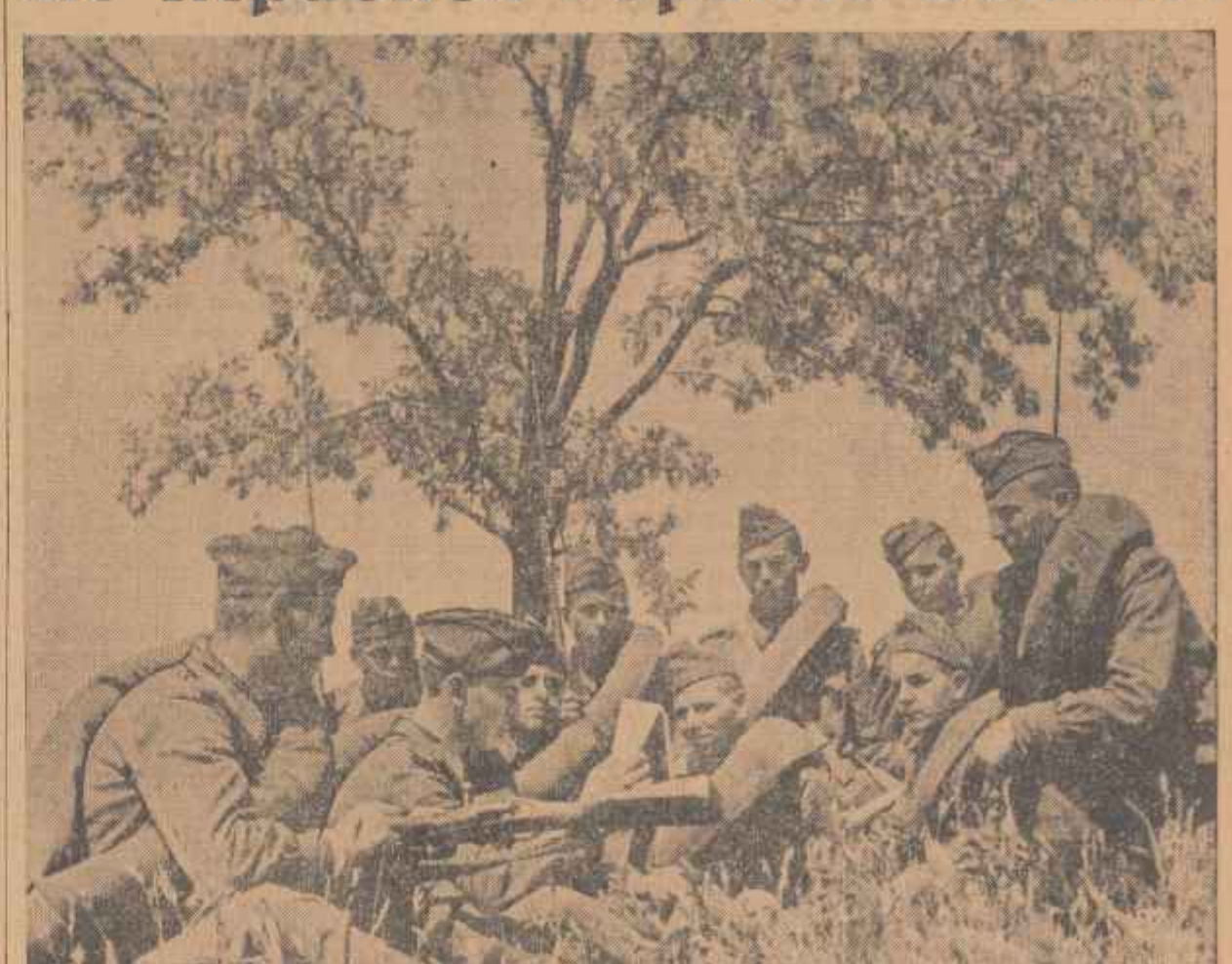
Într-un moment de repaus, pe cîmpul de instrucție, soldații s-au strîns în jurul agitatului care le citește ultimele noutăți dintr-un ziar ostășesc.