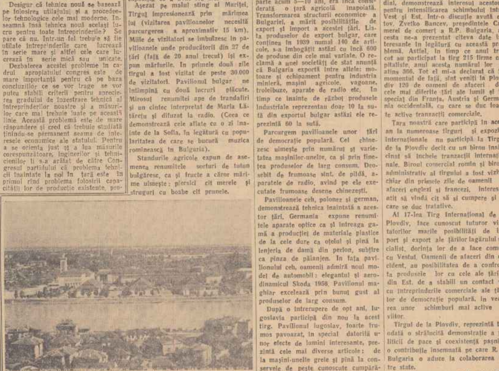
Vedere din orașul Plovdiv

correspondentul „Romîniei Libere” în regiunea Craiova