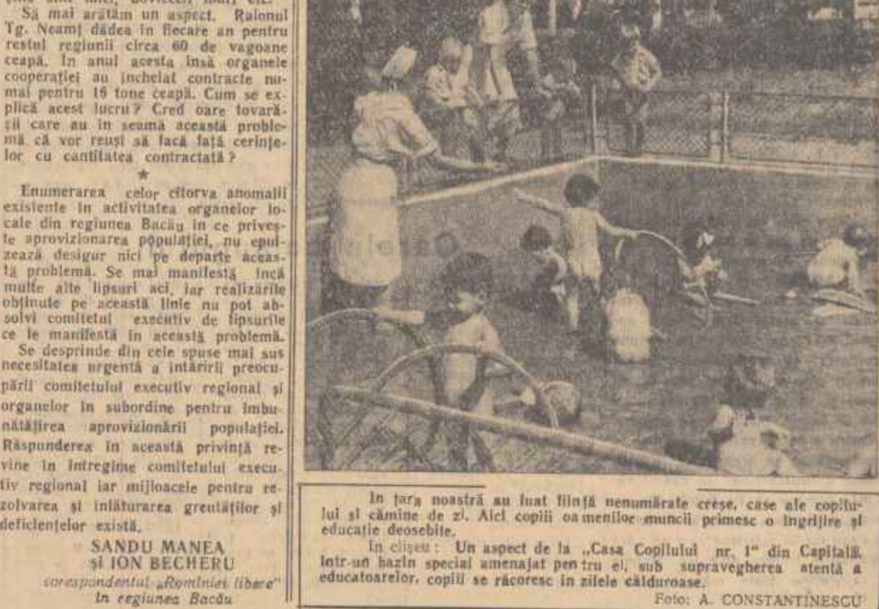
În țara noastră au luat înfățișare nemulțumiri, ca și cele copilului și cămine de zi. Alți copii au menționează-muncii primesc o îngrijire și educație deosebită.