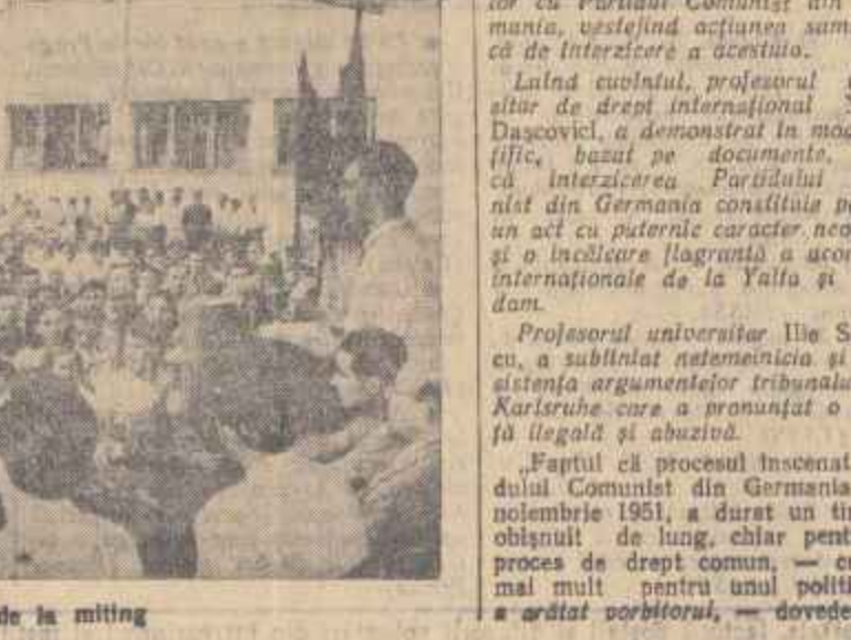
Un aspect de la miting