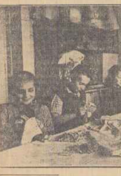
O zi la Casa pionierului din Cluj. Pionierii...