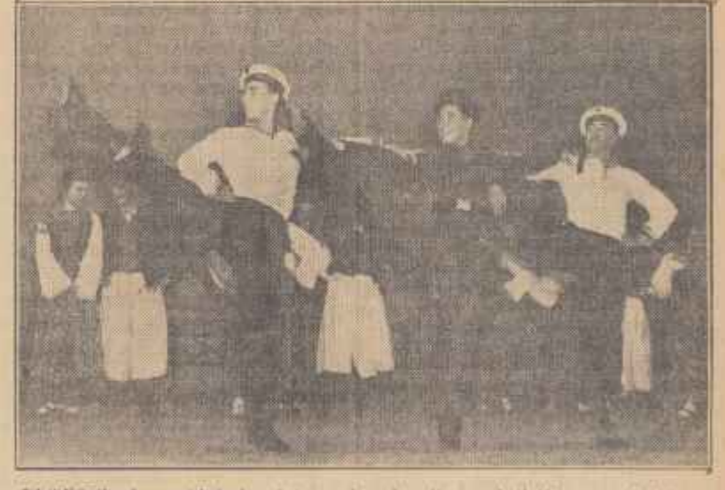
PLOEȘTI. Ansamblul de cîntec și dansuri „Grenzpolizei“ din R. D. Ger- mană a dat vineri seara un spectacol pe scena Teatrului de vară din Ploiești. Spectacolul s-a bucurat de un mare succes.