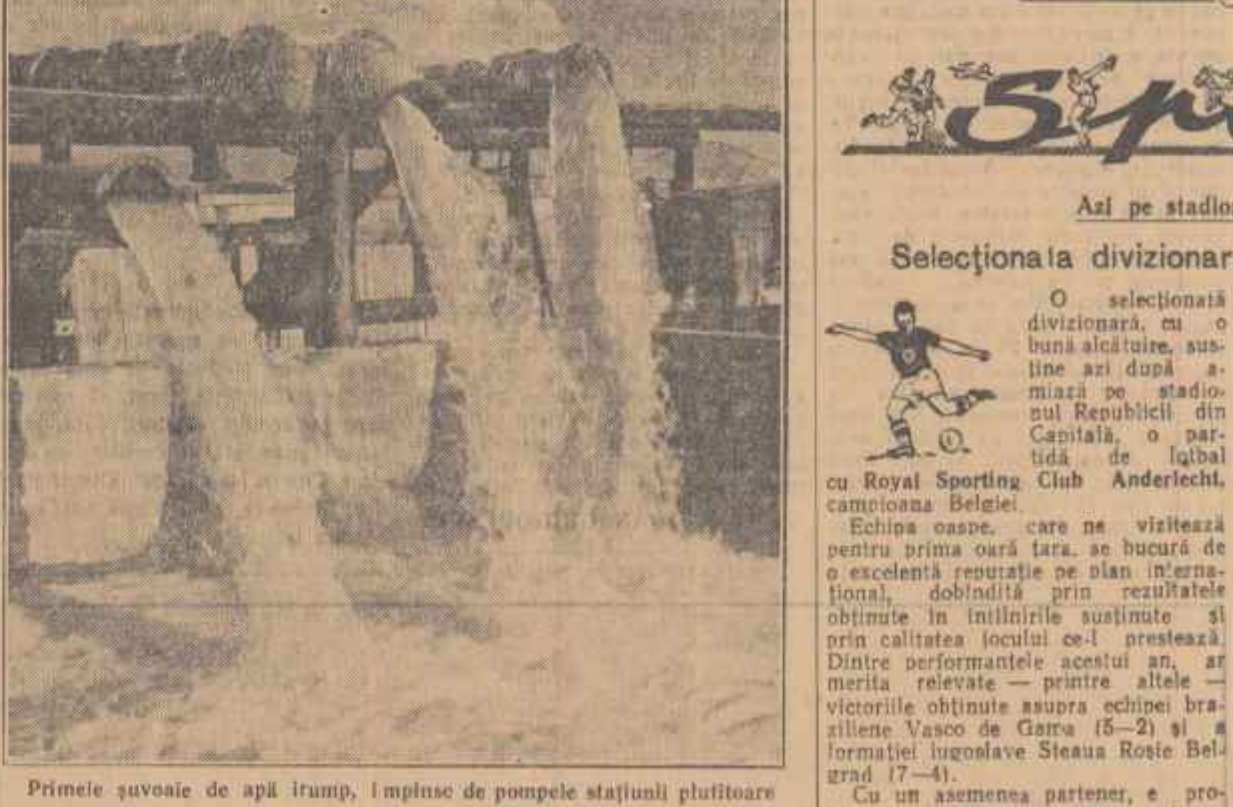
Primele șuvoaie de apă irump, împinse de pompele stațiunii plutitoare

de sorbii pompelor și în mai puțin de o clipă, pe cele trei guri metalice de pe mal izbucnesc cascadele înmărmăte ale multor așezări ape. E și de zăpăcuiță a Dunărea curge fără o încrețitură, pămîntul dogorește ca o pîlă înțînă. În depărtare se văd pe ratele mărginite de canalele argintii ale orăzariilor, batozele orăzariilor, drumurile ce duc departe spre satele din inima Bărăganului, dar aci, pe malul Dunării, în oreaga stației plutitoare a gospodăriei agricole de sat „Iosif Clisci” toți ochii sînt înțîntiți în șuvoaiele puternice, nestăvilită de apă. E în înțrîmarea lor nărușita gemenilor, așteptarea lor, potolirea grîjilor născute de îndoieli, de labouli ogărelor înșelate, de teama din ultimul ceas cînd fiecare om se întrebă: „Vor porni motoarele? Vom avea apă?” Au pornit. Prima stație plutitoare pentru irigația terenurilor agricole, romînească, și-a început viața. IOAN GRIGORESCU