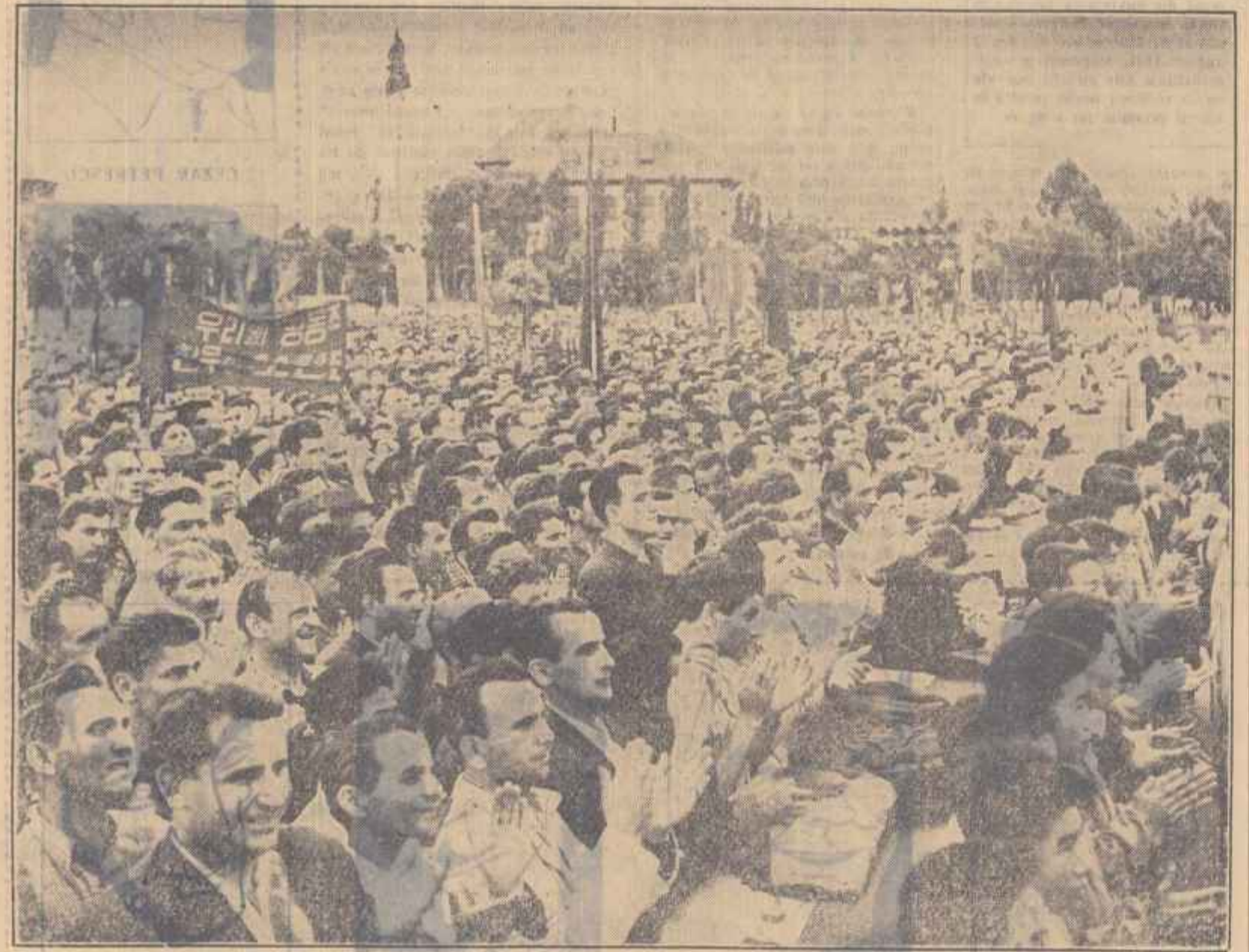
Aspect din timpul mitingului