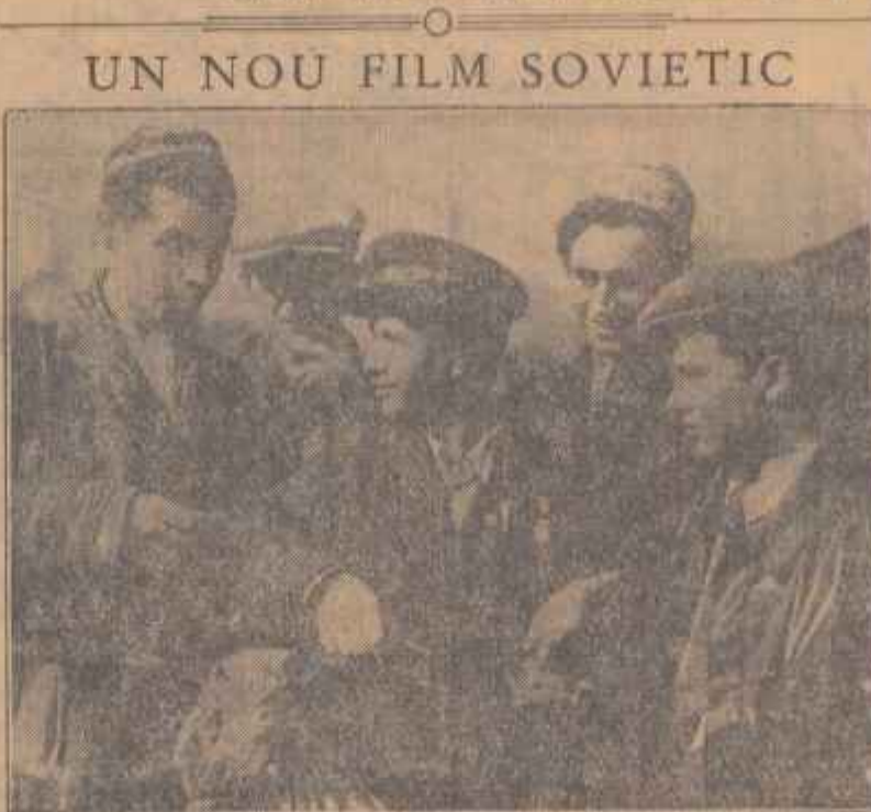
Săptămîna aceasta a început să ruleze în Capitală o nouă producție de cinematograful sovietic, comedia „Maxim Minclună“. În clipu: O scenă din film.