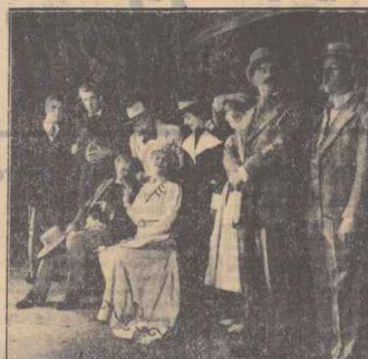
În seara zilei de 7 Iunie a.c. teatrul „L'Atelier din Paris care ne vizitează țara a dat primul spectacol în Capitală. În parca a doua a spectacolului dat în sala Teatrului C.C.S. artiștii francezi au prezentat comedia „Balul hoților” de Jean Anouilh. În cliseu: Scenă din piesa „Balul hoților”.