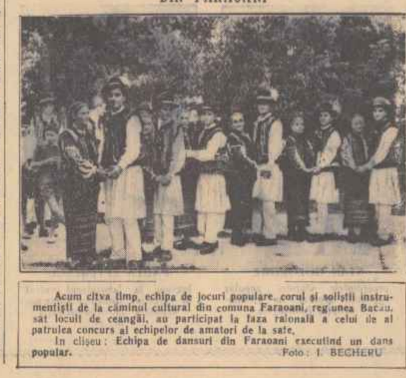
Acum citva timp, echipa de jocuri populare, coral și soliștii instrumentiști de la cîmîntul cultural din comuna Faraoni, reg.unea Bacău, sat locuit de ceangăi, au participat la țara raională a celui de al patrulea concurs al echipelor de amatori de la țara. În cliseu: Echipa de dansuri din Faraoni executînd un dans popular.